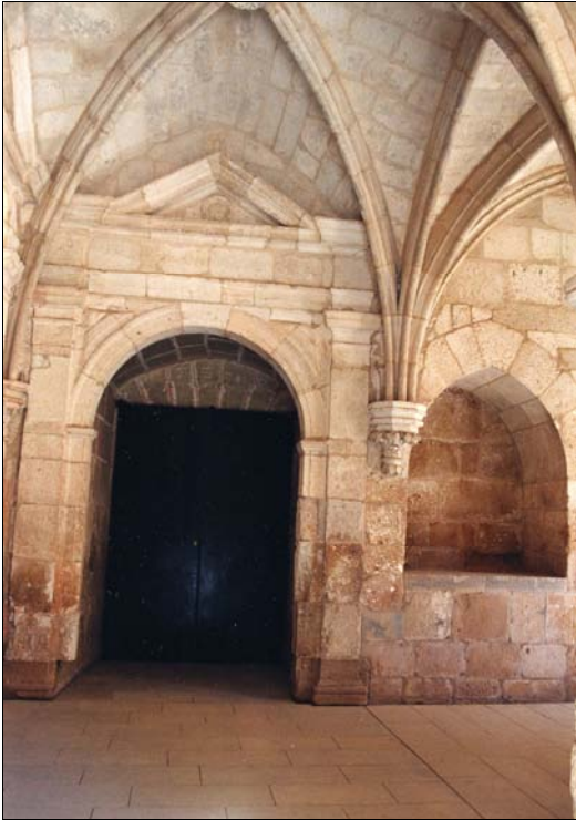
■ Lám. 9. Santa María de Huerta. Panda del Capítulo, vano junto a la Sala de Profundis , sepulcro nº 6.