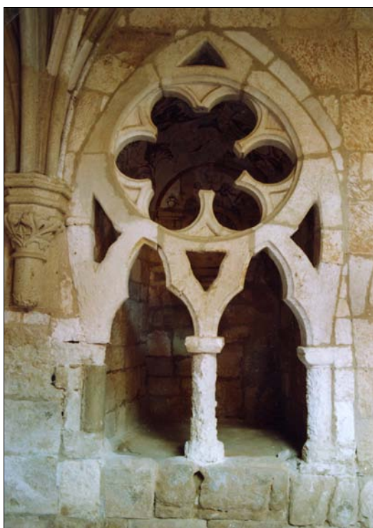
■ Lám. 7. Santa María de Huerta. Panda del Capítulo, sepulcro nº 2.