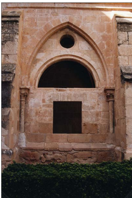
■ Lám. 5. Santa María de Huerta. Intercolumnio cegado del claustro.