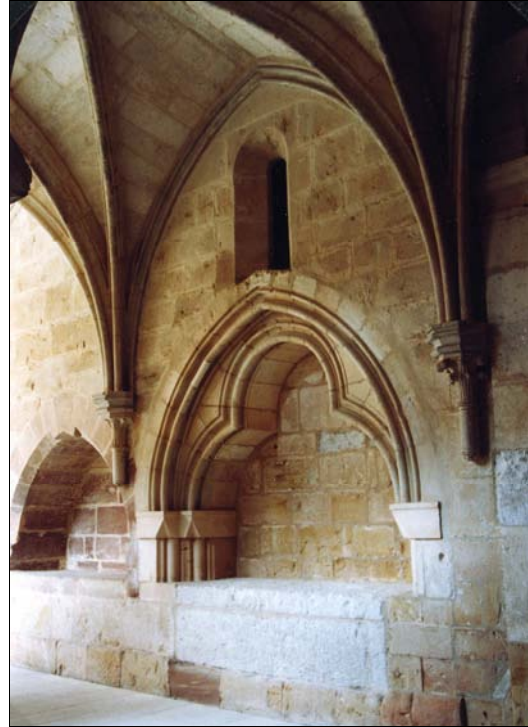
■ Lám. 10. Santa María de Huerta. Panda del Refectorio, sepulcros nº 8 y 9.