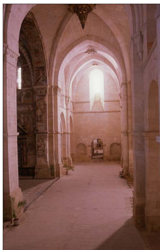
■ Lám. 4. Santa María de Huerta. Iglesia, Brazo sur del transepto.