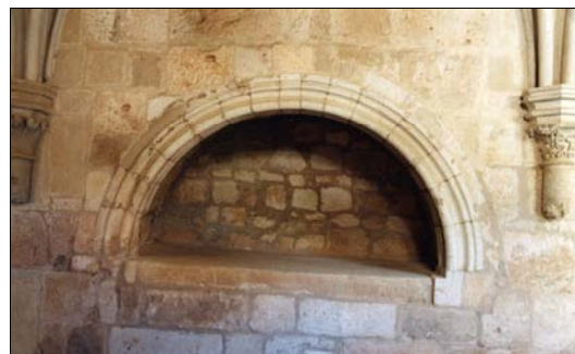
■ Lám. 12. Santa María de Huerta. Panda del Mandatum , detalle sepulcro nº 12.