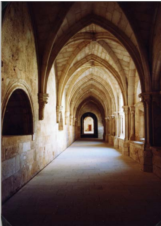
■ Lám. 11. Santa María de Huerta. Panda del Mandatum , sepulcros nº 12 y 11.