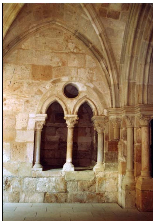
■ Lám. 6. Santa María de Huerta. Panda del Capítulo, antiguo armariolum , sepulcro nº 1.