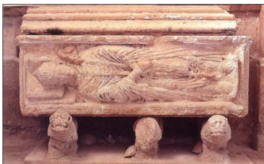
■ Lám. 3. Santa María de Huerta. Iglesia, sepulcro de D. Rodrigo Jiménez de Rada.