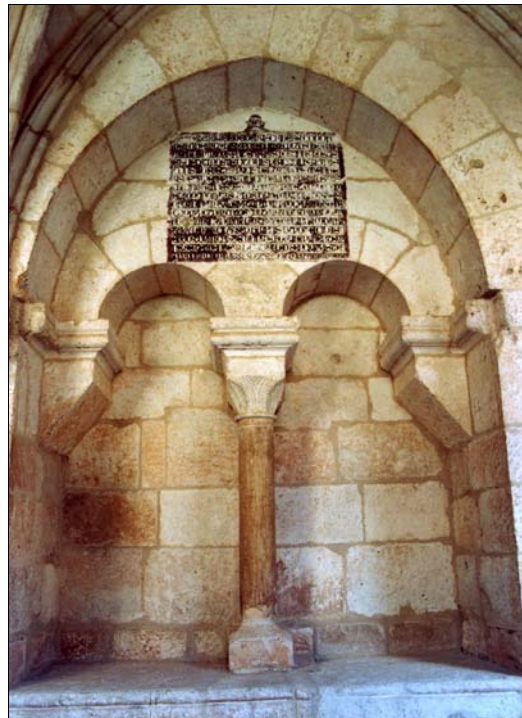
■ Lám. 8. Santa María de Huerta. Panda del Capítulo, ventana Norte de la Sala Capitular, sepulcro nº 5.