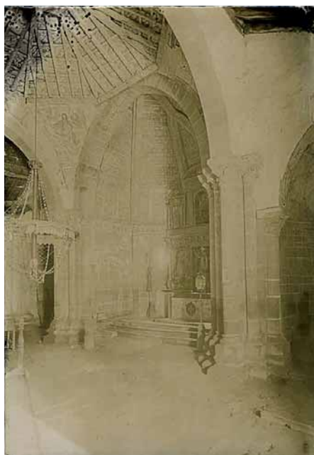
Fig. 4.—Interior de la iglesia del monasterio de San Juan de Montealegre (León) en 1908.