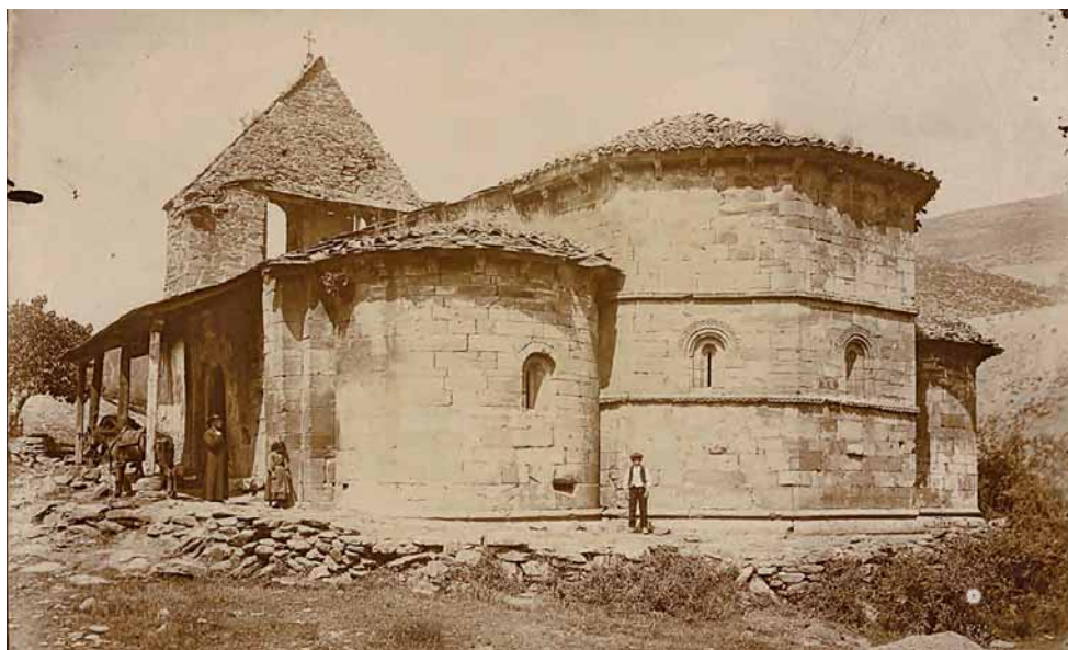
Fig. 3.—Cabecera de la iglesia del monasterio de San Juan de Montealegre (León) en 1908.

Cuando Gómez-Moreno visitó el edificio la situación debió ser muy diferente al desastre actual. Constató la presencia de arcuaciones interiores en los muros del ábside central decoradas con ajedrezado, ventanas abocinadas, espléndida articulación de molduras, tanto interiores como exteriores y uso de canecillos en los aleros «que presentan una figura con dos cabezas, bustos deformes, un hombre sentado obscuro, cabezas de león, toro y carnero y más figuras humanas». Por su testimonio sabemos que en el muro meridional se abría una portada «de disposición románica» y remarcó la utilización de capiteles esculpidos 8 .