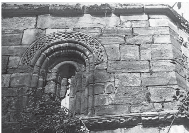
Fig. 9.—Ventana del ábside de San Juan de Montealegre (León), 1985.

Interés Cultural, con categoría de monumento, a favor de esta iglesia del Ayuntamiento de Villagatón 19 .