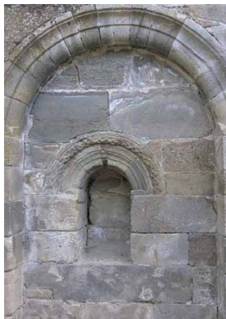
Fig. 7.—Monasterio de San Juan de Montealegre (León). Arcuación del paño de muro sur del ábside central. 2014.

León, D. Antonio Viñayo (1922-2012), quien en numerosas ocasiones denunció el estado en el que se encontraba el edificio 16 . No sería el último intento de preservar y reubicar las ruinas medievales y de ello me ocupo detenidamente en la publicación antes citada.