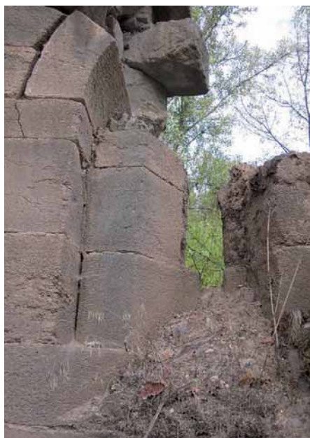
Fig. 6.—Monasterio de San Juan de Montealegre (León). Ventana del ábside sur. 2014.