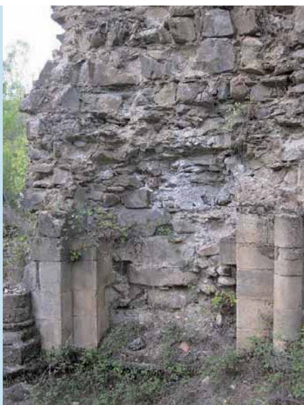
Fig. 8.—Monasterio de San Juan de Montealegre (León). Expolio de la arcuación del paño de muro norte del ábside central. 2014.