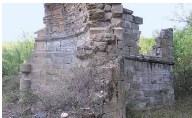
Fig. 2.—Cabecera de la iglesia del monasterio de San Juan de Montealegre (León) en 2014.

No ocurre así con la cabecera, sin duda la parte más antigua, monumental y mejor construida de todo el conjunto y que se proyectó abovedada. A pesar de las reformas documentadas en el siglo XVI y la construcción de una gran espadaña, los tres ábsides románicos permanecieron inalterados. De hecho, aún hoy es el elemento mejor conservado y más reconocible entre la maleza y las ruinas, confirmando el dominio técnico de la arquitectura que manejaban sus constructores en las postrimerías del siglo XII (Fig. 2).