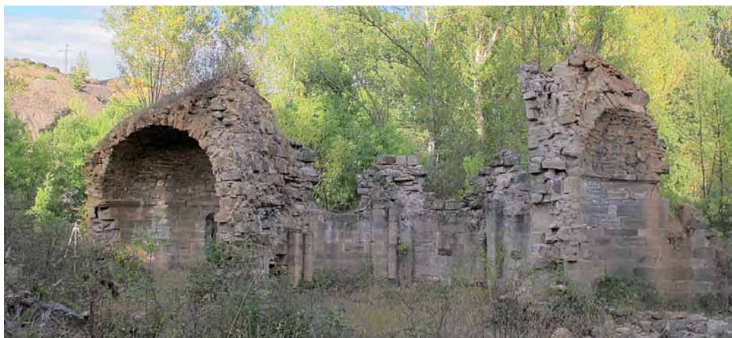
Fig. 1.—Monasterio de San Juan de Montealegre (León). 2014.

1 GIL Y CARRASCO, E.: El Señor de Bembibre , Madrid, 1844, p. 40.