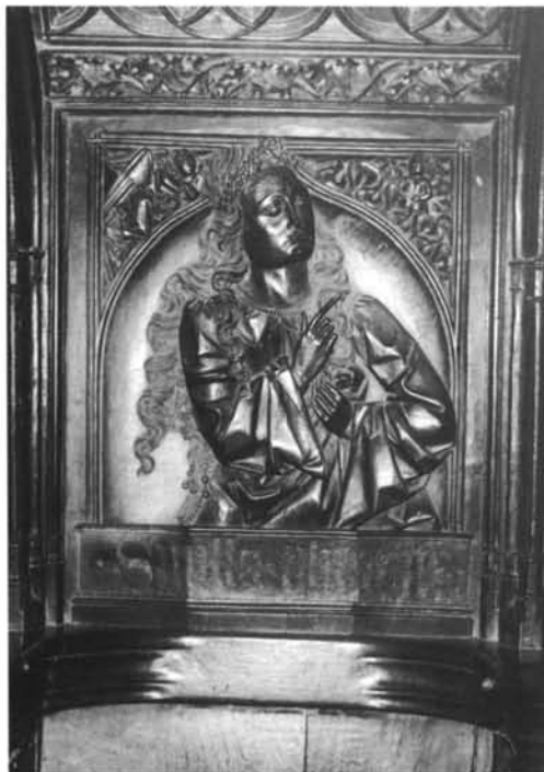
1. Oviedo. Catedral. Capilla del Rey Casto. Virgen del Parteluz.-2. León. Catedral. Sillería. Respaldo bajo. Sibila Tiburtina.