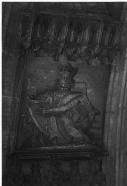
1. León. Catedral. Sillería. Panel del testero derecho. David en el Arbol de Jessé.—2. Oviedo. catedral. Capilla del Rey Casto. Arquivolta exterior izquierda. David.