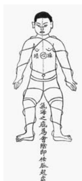
LA ENERGÍA “DE ENROLLAMIENTO DE SEDA” DEL CHEN TAIJIQUAN REPRESENTADA EN LA OBRA EXPLICACIÓN ILUSTRADA DEL CHEN TAIJIQUAN, DE CHEN XIN.