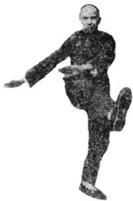
CHEN ZHAOPEI – EL MAESTRO QUE REVIVió LA PRÁCTICA DEL TAIJIQUAN EN CHENJIAGOU.

Hoy, cuando la mayoría de personas practica artes marciales con fines deportivos, de salud, y recreativos, es fácil perder la perspectiva de la seriedad de vida y muerte de la habilidad marcial en el pasado. Un artículo de la revista Shaolin Yu Taiji se refiere al libro de Wu Wenhan El libro completo de la esencia y las aplicaciones del estilo Wu [Yuxiang] de taijiquan que contiene una visión fascinante en la historia de combate del Chen Taijiquan. Refiere dos documentos oficiales del gobierno que dan cuenta de la defensa del Condado de Huaqing (donde se localiza Chenjiagou) contra la rebelión militar de Taiping en 1853. Uno se titula “Registro auténtico del ejército de Taiping atacando el Condado de Huaqing”, escrito por Tian Guilin, quien fue responsable de “defender el poblado occidental” en Huaqing. El otro es “Registros diarios de la defensa de Huaqing”, compilado por un maestro local de la escuela Ye Zhiji (Jian, G., 2002).