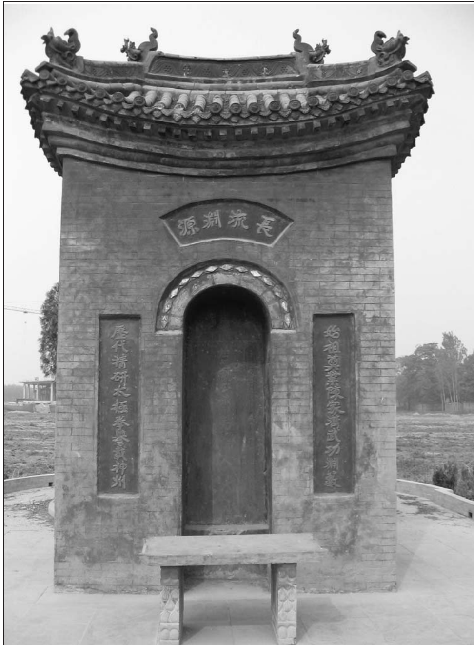
MONUMENTO CONMEMORATIVO DE CHEN BU – PATRIARCA DE LA FAMILIA CHEN Y FUNDADOR DE CHENJIAGOU.