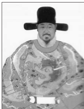
EL GENERAL QI JIGUANG, CUYO LIBRO SOBRE ESTRATEGIA MILITAR INSPIRÓ EL NUEVO ARTE DEL TAIJIQUAN.