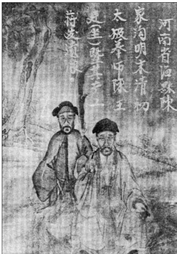
COPIA DE UNA PINTURA DE CHEN WANGTING PERDIDA DURANTE LA REVOLUCIÓN CULTURAL.

Durante la Revolución Cultural y el período de malestar social que la precedió, la mayoría de estructuras de la aldea relacionadas con el taijiquan se destruyeron (Wang, J., 2006: 6). La localización de la tumba de Chen Changxing se perdió con la eliminación de su lápida y también se perdieron un número de artefactos inestimables, incluyendo la espada de Chen Wangting y un retrato de Chen Wangting con