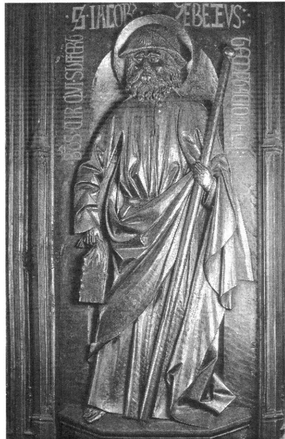
Lámina 4. Santiago Peregrino. Sillería alta del Coro.

En la segunda mitad del siglo XV se fecha la imagen de Santiago Peregrino en piedra caliza