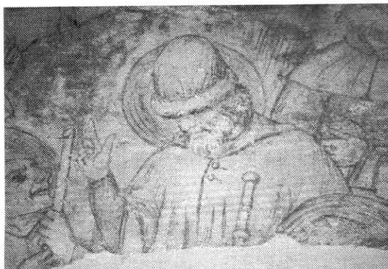
Lámina 1. Santiago Peregrino. Escena de la Ascensión. Pintura mural ejecutada por Nicolás Francés. Claustro

ramiento del Apóstol, si seguimos la narración contenida en el " Liber Sancti Iacobi ". Se trata de una gran iglesia, una gran catedral de estilo gótico, y en su interior podemos ver -no a la Reina Lupa, a la que no se hace ninguna mención- a un peregrino 18 depositando una ofrenda ante el altar del Apóstol.