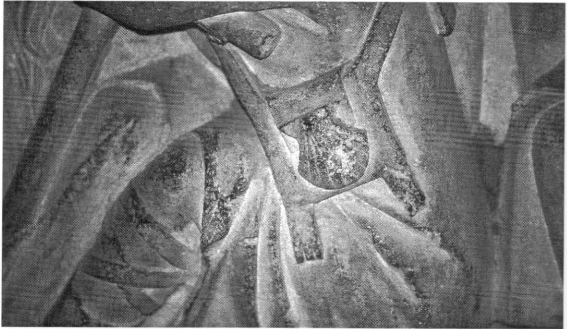
Lámina 6. Zurrón decorado con una venera. Detalle del sepulcro de don Martín el Zamorano. Crucero Norte

pomo redondeado en la parte superior y puntera metálica en la inferior. Es de tamaño medio, por lo que llegaría aproximadamente hasta los hombros del Apóstol si éste apareciese erguido 38 .