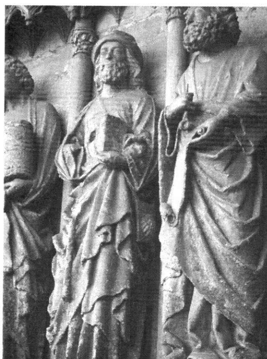
Lámina 2. Santiago Peregrino. "Maestro de los Apóstoles". Jamba izquierda de la Portada del Juicio. Fachada Occidental

En la Portada de la Virgen del Dado, en el crucero norte, datada hacia 1290-1300 23 , encontramos al Apóstol Santiago junto a San Pedro y San