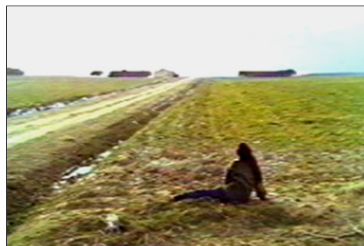
■ Lám. 10. La soledad de Emilia ( Los ojos vendados , 1978).