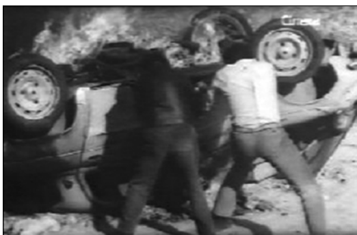
■ Lám. 5. La crisis insuperable de la pareja ( Stress es tres tres , 1968).