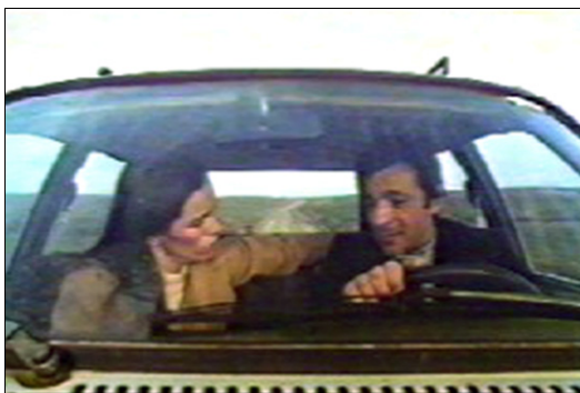
■ Lám. 9. La armonía de la pareja ( Los ojos vendados , 1978).