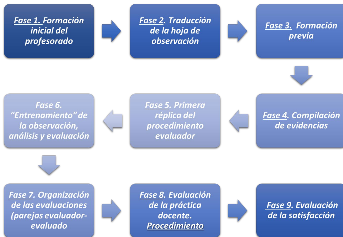
Figura 1. Fases realizadas en la experiencia

de la docencia, tanto la propia (autoevaluación) como la de sus compañeros (coevaluación).