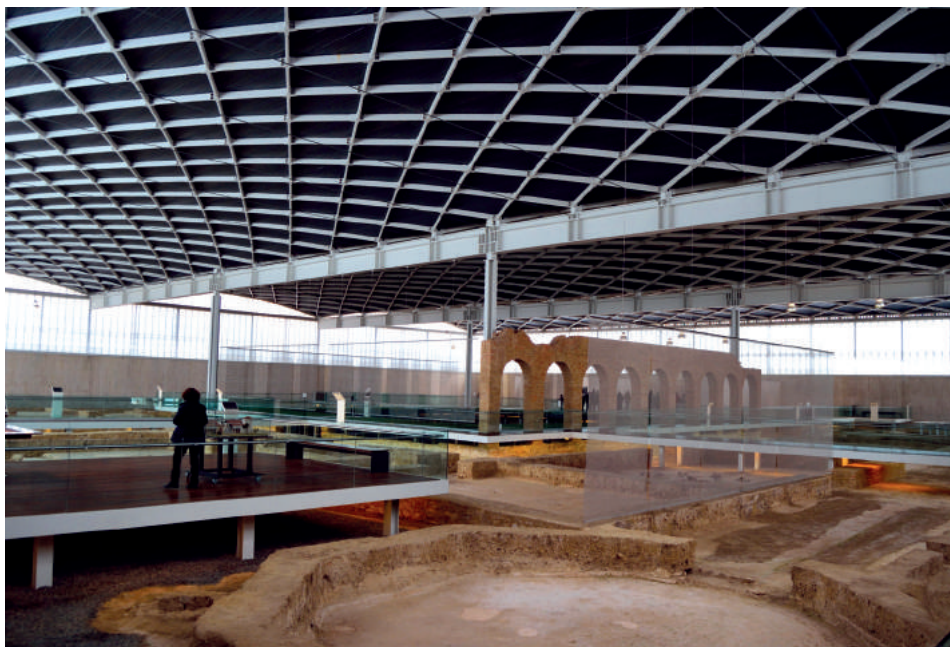
Fig. 5. Vista interior de la cubierta de la villa.

matérico y formal es completamente abstracto, de manera que no interrumpe la visión de los restos. Además, su presencia se minimiza al apoyar sobre un cuerpo de ventanas que subrayan la gracilidad de su estructura. Este gran ventanal corrido, que al exterior se corresponde con el cuerpo de acero corten, se cierra con uralita, permitiendo la entrada de luz natural en todo el interior, además de mantener el contacto visual y ambiental con el entorno. La fuente de luz natural, con una dirección lateral alta, se completa con focos de luz artificial dispuestos a lo largo de toda la cubierta.