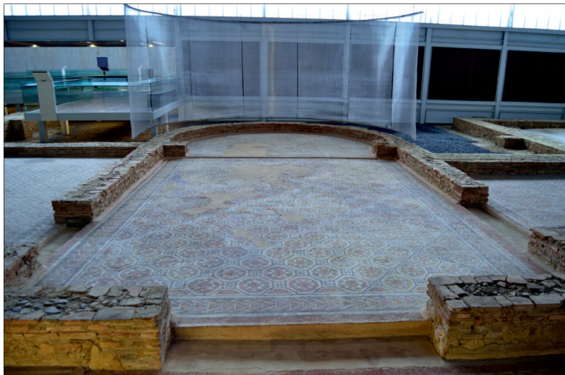
Fig. 2. Vista de uno de los remates en exedra.

con mosaicos. Mientras, el resto de las habitaciones estaban pavimentadas con opus signinum y seguramente estaban destinadas a un uso privado y cotidiano. En la parte norte, destacan sobre el conjunto dos salas rematadas con exedras, así como el hallazgo del hipocausto en una de las estancias del lado este (Figura 2). La simetría que caracteriza esta zona se pierde completamente en el lado sur, cuyas habitaciones no debían ser residenciales a juzgar por los objetos hallados en ellas. Los huecos en el suelo de algunas estancias, por ejemplo, se han vinculado con su empleo para la fabricación de vino; en otros casos, los restos de ánforas denotan su posible uso como almacén.