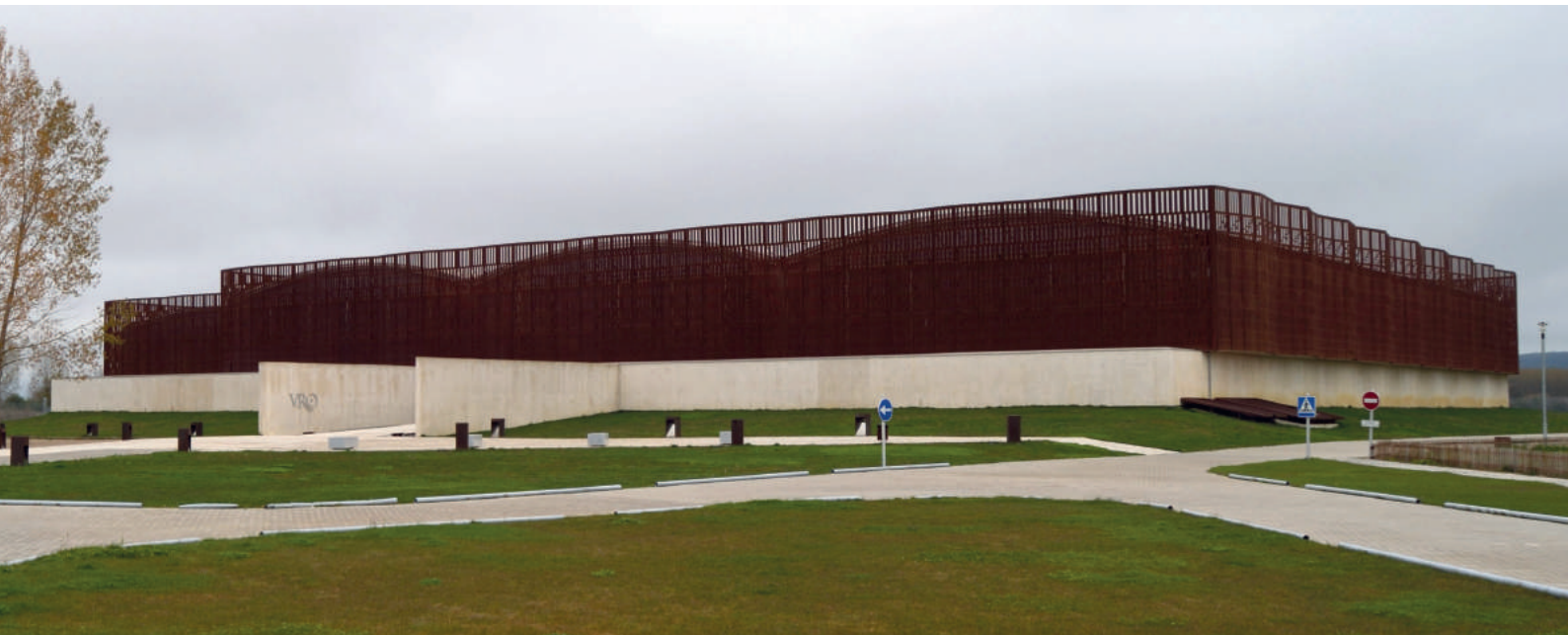
Fig. 4. Exterior del cerramiento de La Olmeda.

Con todo, el exterior es el resultado de la persecución por parte de los arquitectos de uno de los objetivos comunes a todos sus proyectos: la adecuación de las obras al entorno en el que se desenvuelven. Este intento de conciliación entre arquitectura y naturaleza no supone, sin embargo, una mimesis literal, más bien un acercamiento al paisaje a través de un lenguaje arquitectónico contemporáneo y de la elección de los materiales más adecuados al entorno (Paredes y Pedrosa 2004:54-60) 7 . La arquitectura se proyecta, por tanto, hacia un territorio que no sólo incluye el paisaje sino que integra una tradición, una función específica y unos contenidos particulares que han condicionado el proyecto.