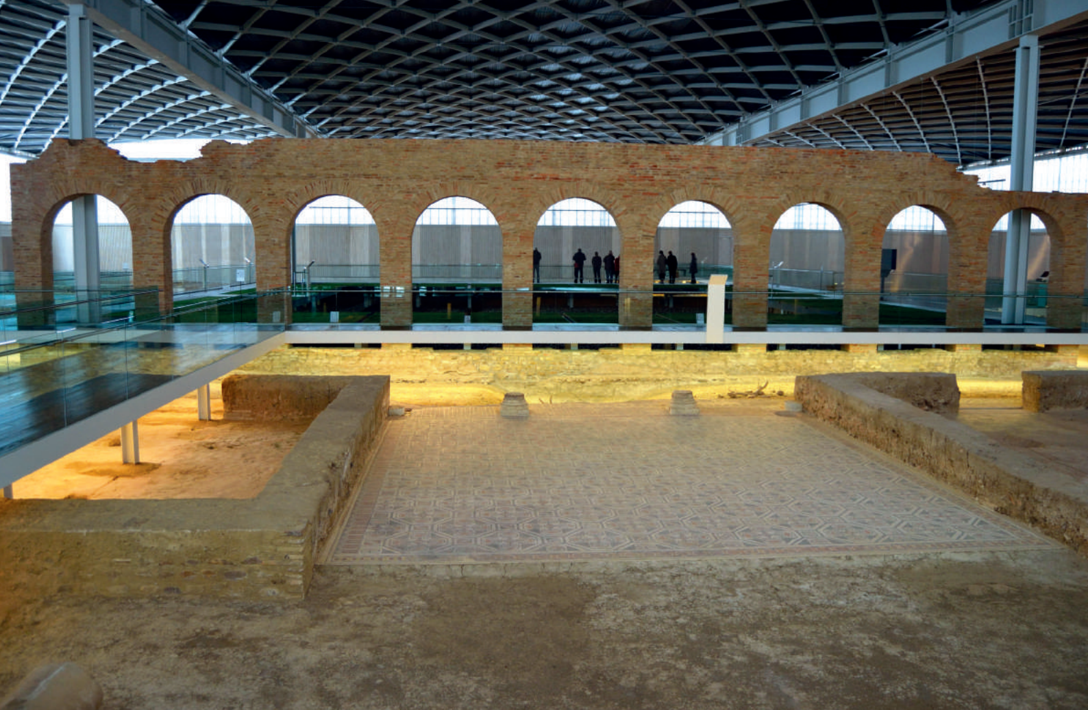
Fig. 3. Arcada reconstruida.

Pero sin duda, son los mosaicos de pavimento los que constituyen la principal particularidad de la villa, haciendo de ella un foco de atracción turística. Constituyen un total de 12, distribuidos en temas mitológicos –es destacado, por ejemplo, el dedicado a Aquiles–, cacerías –con un sentido propagandístico–, geométricos y florales, junto a varios tondos con retratos, posiblemente de los propietarios de la casa (Blázquez 1987:365-370).