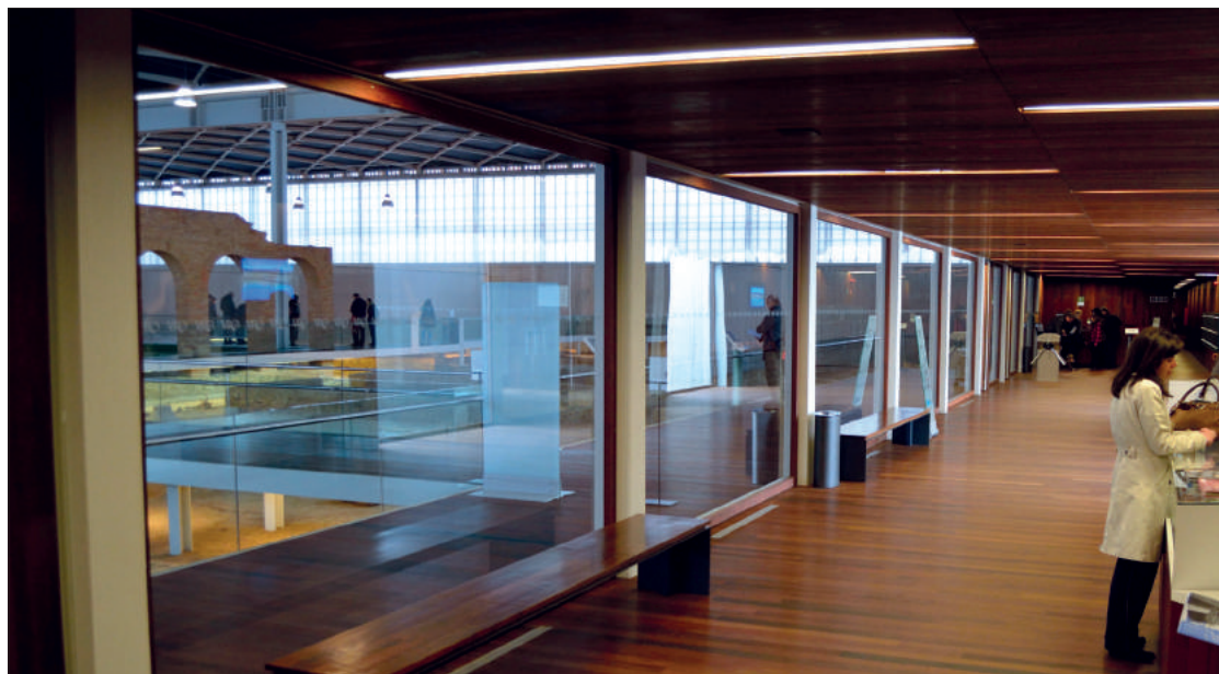
Fig. 6. Vista de la zona de servicios con la villa al fondo.

aplicación de una museografía que no complete ni reconstruya, sino que incite al espectador a completarla de manera conceptual.