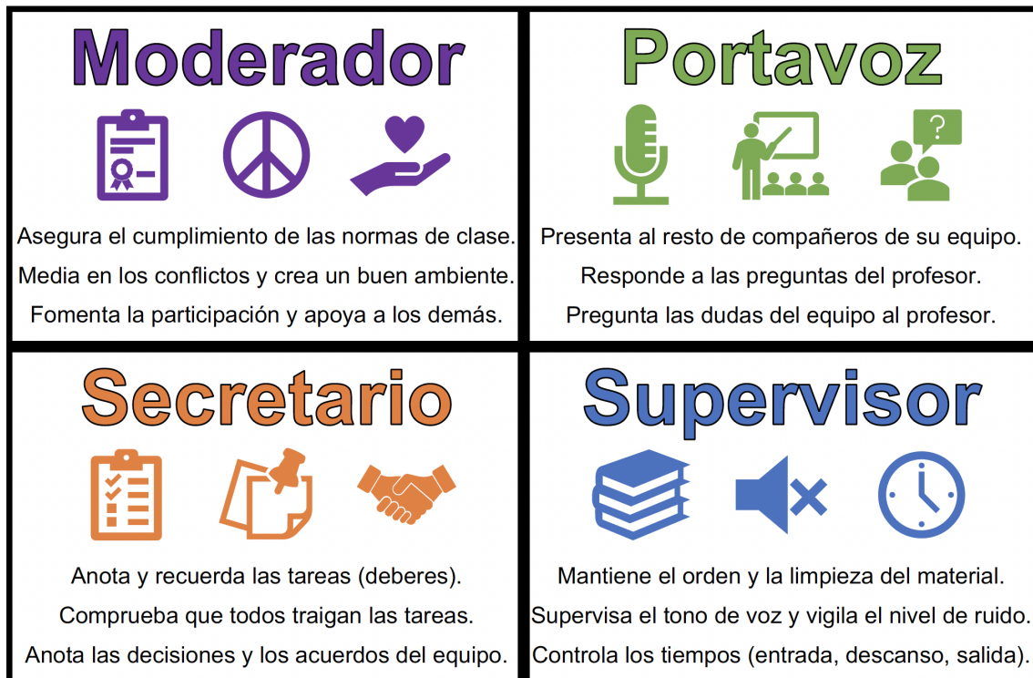
Figura 1.- Roles y sus funciones para las clases teóricas de Unidiversidad.

En nuestro programa, el alumnado es dividido en cuatro grupos heterogéneos de entre 4-5 participantes, en base a distintos criterios como la Teoría de las Inteligencias Múltiples de Howard Gardner (1983) o el Modelo de los Cuadrantes Cerebrales de Ned Herrmann (1995). Estos grupos de aprendizaje cooperativo se mantienen durante la realización de cada módulo de formación (trimestral) siempre y cuando las relaciones interpersonales y el rendimiento de los grupos sea el adecuado. Los componentes de cada uno de los cuatro grupos asumen los siguientes roles: