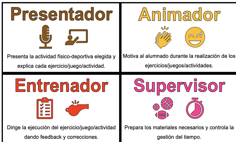
Figura 2.- Roles y sus funciones para las sesiones prácticas de Unidiversidad

El profesorado utiliza una escala Likert para valorar la sesión práctica, valorando aspectos relacionados con la ejecución de la sesión (estructuración de la sesión, adecuación y coherencia de los ejercicios, explicación y dirección de los ejercicios...). Mediante la técnica de la observación directa se recogen datos que se comentan y reflexionan junto con el alumnado al finalizar la sesión.