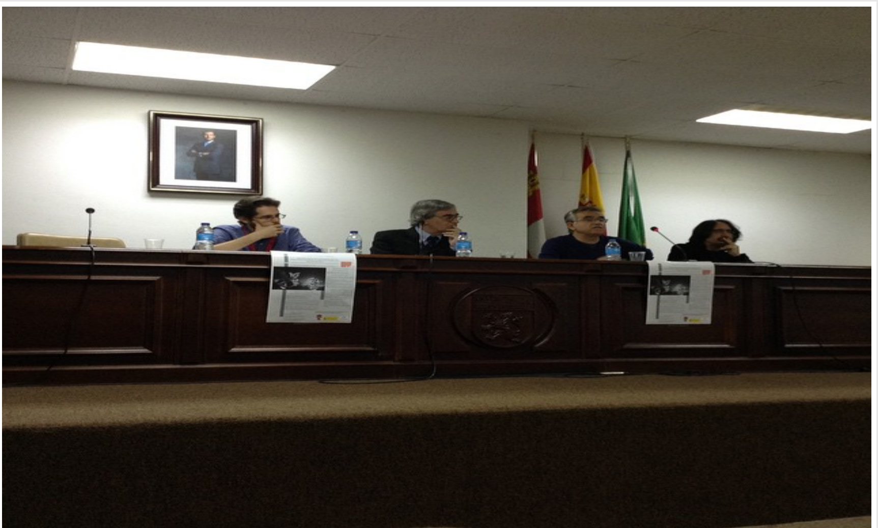
Jueves sesión I aula magna