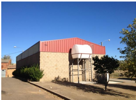
Lugar actual donde se encontraba la Iglesia del Salvador (Valdemora)