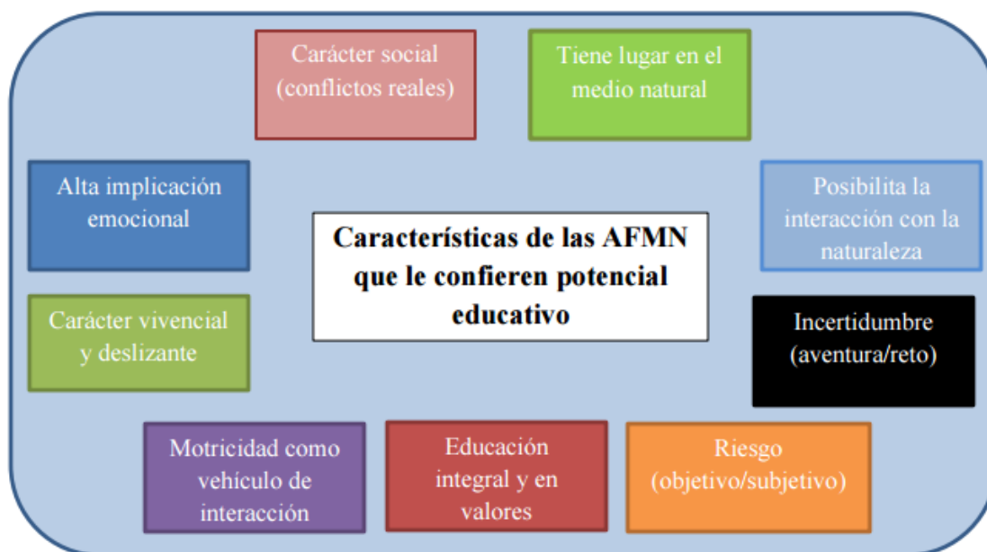
Cuadro 1. Características de las AFMN que le confieren potencial educativo. Muñoz (2012). Recuperado de: https://uvadoc.uva.es/bitstream/10324/3191/1/TFG-B.225.pdf

Además, siguiendo a esos últimos autores que se apoyan en Acuña (1991), Bravo y Romero (1998), Giralt y Macià (1989), González, Hernández, Martínez, Soriano, y Ureña (1997), Parra y Rovira (2006) Santiuste y Villalobos (1994), Santos y Guillén (2004), es idóneo para el desarrollo psicológico (aumenta su autoestima, confianza, bienestar...), social (mejora su cooperación grupal, comunicación, respeto...), educativo (incrementa su rendimiento académico, capacidad de resolver problemas, conciencia de valores, conservación del medio...) y físico (equilibrio personal, mejora de la condición física...). (Cuadro 1)