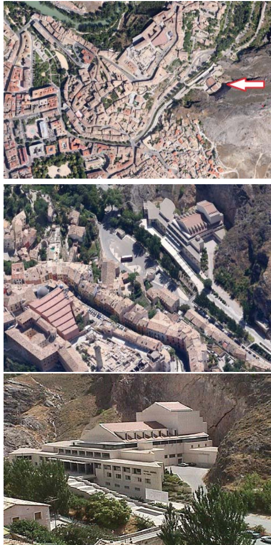
Figs. 1,2 y 3. Situación y perspectivas del Teatro-Auditorio de Cuenca.