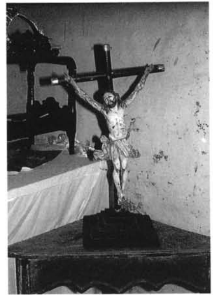
Fig. -11: Crucificado de la sacristía de la iglesia de Susudel. Obra probable de Vélez.

La última pieza de interés que encontramos en este templo de Susudel es un cáliz manierista, sobredorado, del siglo XVII que mide 23 cm. de altura por 13 de diámetro de la base (lám 13). La pieza, como sus semejantes, y dentro de la uniformidad que estas obras tuvieron, dispone de un pie poco elevado con las tres zonas tradicionales. El astil dispone