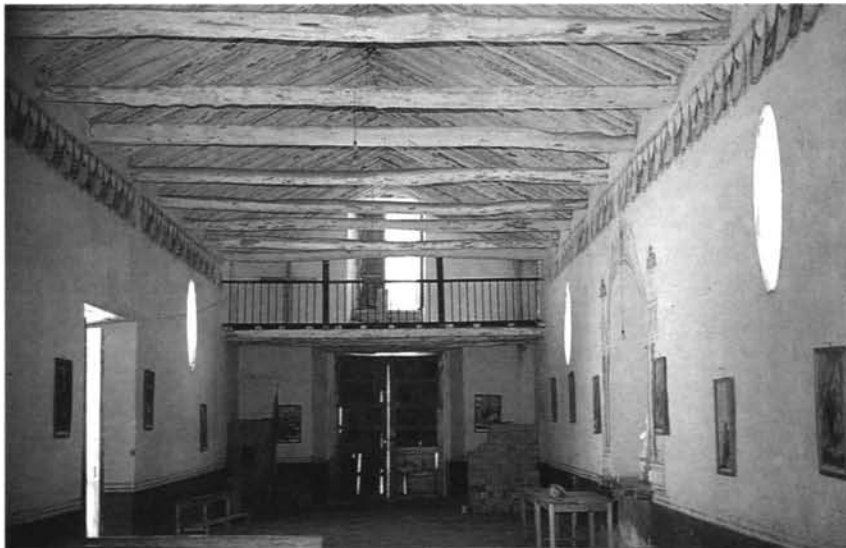
Fig. -2: Vista del interior de la iglesia de Susudel.

5. "Cárcel de Cuenca" Hemeroteca del Banco Central de Cuenca (Ecuador).