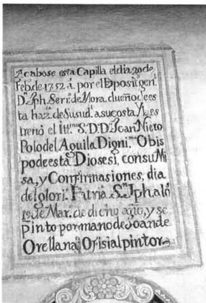
Fig. -3: Inscripción en el presbiterio de la iglesia de Susudel.