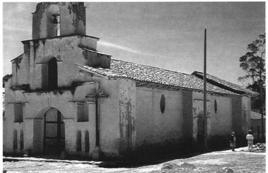
Fig. -1: Vista exterior de la iglesia de Susudel.

La nave central tiene puertas de acceso en el lado del evangelio y a los pies. En el lado de la epístola se rompe su continuidad con un arco rehundido que sirve de altar, frente a la portada lateral y, en el mismo lado, una puerta, casi a los pies del templo, da acceso al baptisterio. Este