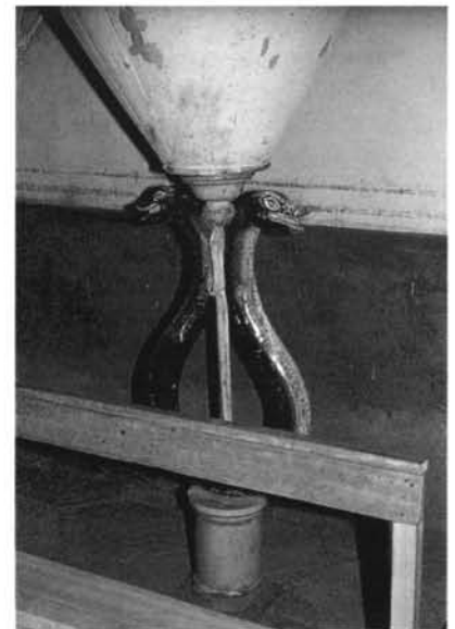
Fig. -12: Detalle del púlpito de la iglesia de Susudel.