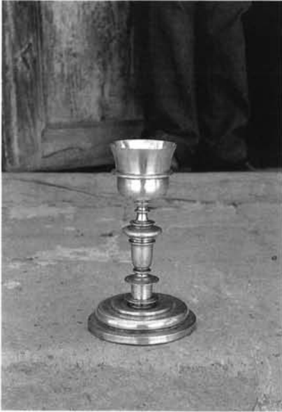
Fig. -13: Cáliz de la iglesia de Susudel . Siglo XVII.

de un gollete entre platos, un nudo de jarrón con toro y un cuello tronco-cónico de perfil de convexo. La copa, que tiende a abrirse hacia el borde, se divide en su tercio inferior por una arandela saliente. Como se puede apreciar, la pieza apenas presenta diferencias respecto de otras semejantes ya publicadas para la Audiencia de Quito (37) y es la única obra de plata digna de mención que se conserva.