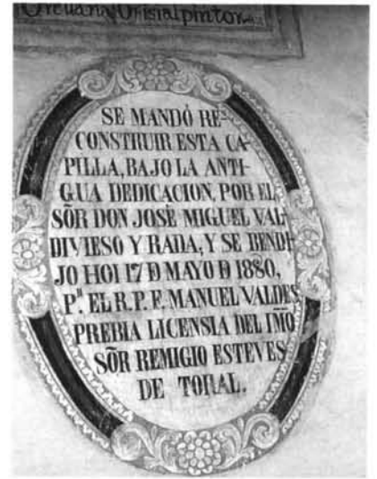
Fig. -8: Inscripción de la refacción decimonónica de la iglesia de Susudel.

Pero de las pinturas decimonónicas, la más interesante es la que encontramos en la hornacina frente a la puerta lateral de acceso a la capilla (Fig. 9). Lo mismo que en el presbiterio había ocurrido con anterioridad, se trata de crear un retablo arquitectónico donde no existía y ello se va a ejecutar con un sabor neoclásico típico de lo que podemos denominar "neoclasicismo azuayo". Las pervivencias barrocas en el "nuevo estilo" son a veces más importantes que los aportes clasicistas. Sobre un pequeño plinto se elevan a cada lado dos columnas corintias que sostienen una cornisa donde se ubica un jarrón con flores. Formando el arco se aprecia una forma de borde mixtilíneo con una sencilla decoración vegetal en los laterales; en el centro se ubica un óvalo con los signos de la pasión de Cristo. En el conjunto dominan los rojos y dorados, aunque con una tonalidad diferente a la de las pinturas coloniales. Esta obra, por tanto, nos pone en contacto con la retablistica cuencana del momento y ningún ejemplo mejor ni más cercano que el propio retablo de esta iglesia (Fig. 10).