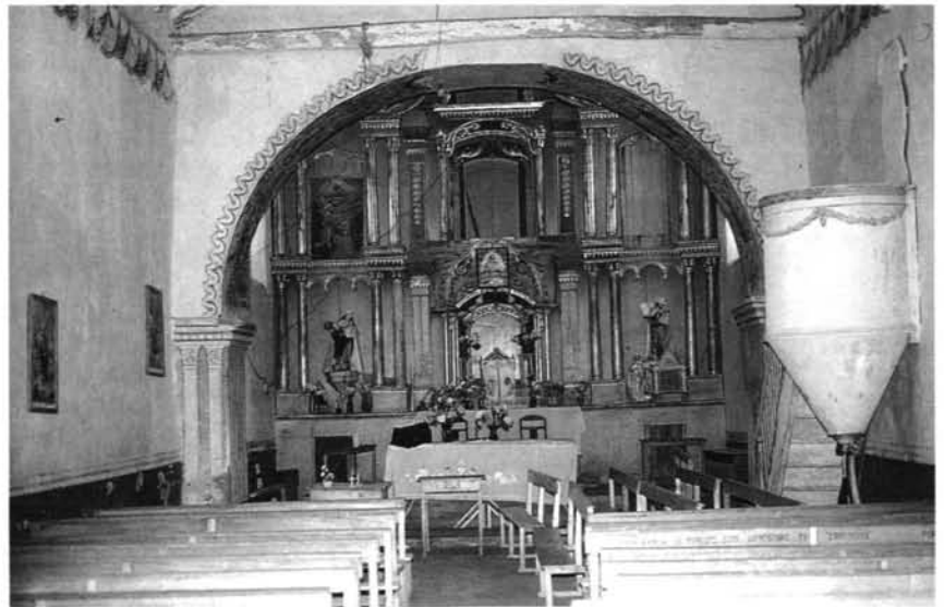
Fig. -10: Vista de la nave y el retablo de la iglesia de Susudel.

El retablo de dos cuerpos y remate se compone de tres calles separadas por columnas corintias de fuste liso; si bien la central se enmarca por pilastras. Se halla pintado en tono gris salvo los elementos decorativos vegetales, los capiteles y los bordes de las arquitecturas que se han dorado. La decoración vegetal en el cuerpo central y el borde ondulado y movido de la parte superior dicen muy poco en favor del neoclasicismo, incluso ya se aprecian atisbos de los "neos" en los arquillos lombardos del cuerpo bajo de las calles laterales. Esto último no debe extrañar, pues desde 1875 el Hermano Redentorista Juan Bautista Stiehle, al que ya hemos mencionado, estaba trabajando en Cuenca y había introducido en la ciudad el gusto por los "neos" (33).