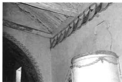
Fig. -7: Detalle del púlpito y pinturas de la nave de la iglesia de Susudel.

Otro resto pictórico que nos queda del siglo XVIII está en el arco toral, cuyo intradós se decora con las figuras de los cuatro evangelistas en el siguiente orden: San Lucas, San Juan, San Marcos y San Mateo. Son figuras hieráticas, colocadas también con un paisaje al fondo, enmarcadas todas ellas en una cartela y a las que acompaña su símbolo respectivo (Fig. 6), que en el caso de San Lucas es el de un pequeño ángel entre sus brazos. En estas pinturas resulta de más calidad el enmarque que la propia figura y siguen predominando los colores cálidos, aunque el fondo blanquecino de los cielos se nos presenta como una novedad, si es que corresponde a la composición original. En el trasdós una línea de acantos completa la decoración.