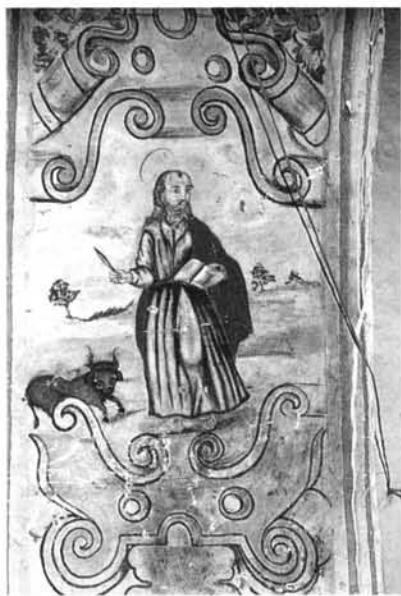
Fig. -6: San Lucas. Arco toral de la iglesia de Susudel.

28. J. PANIAGUA PEREZ, op. cit., pp. 112-113.