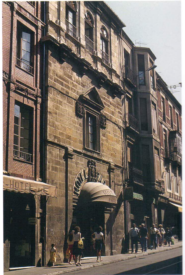
Palacio de los Villasinda en la calle Ancha de León (S. XVI). Algunos miembros de la nobleza leonesa pasaron a ejercer cargos administrativos en las Indias. Precisamente un miembro de esta familia Villasinda fue nombrado juez de residencia y gobernador interino de Venezuela, en 1541.

Por la amplitud que podría tener, este apartado lo hemos de limitar a la época de dominación española en el continente americano. Esto no quiere decir que la labor de los universitarios leoneses o relacionados con León acabase con las independencias de las primeras décadas del siglo XIX. Aun quedaban Cuba, Puerto Rico y Filipinas, y aún estaba por venir una emigración y fuga de intelectuales y gentes de todas las condiciones, alimentada en buena medida por algunos de los trágicos momentos de la Historia de España o por el afán cristianizador que siguió manteniendo el catolicismo peninsular. De esos leoneses del mundo contemporáneo relacionados muy directamente con América podemos mencionar a Gumersindo de Azcárate, presentado a diputado por Puerto Rico y casado con una Innerarity, familia de origen escocés con grandes intereses en Cuba; Gordón Ordás, forzado a un