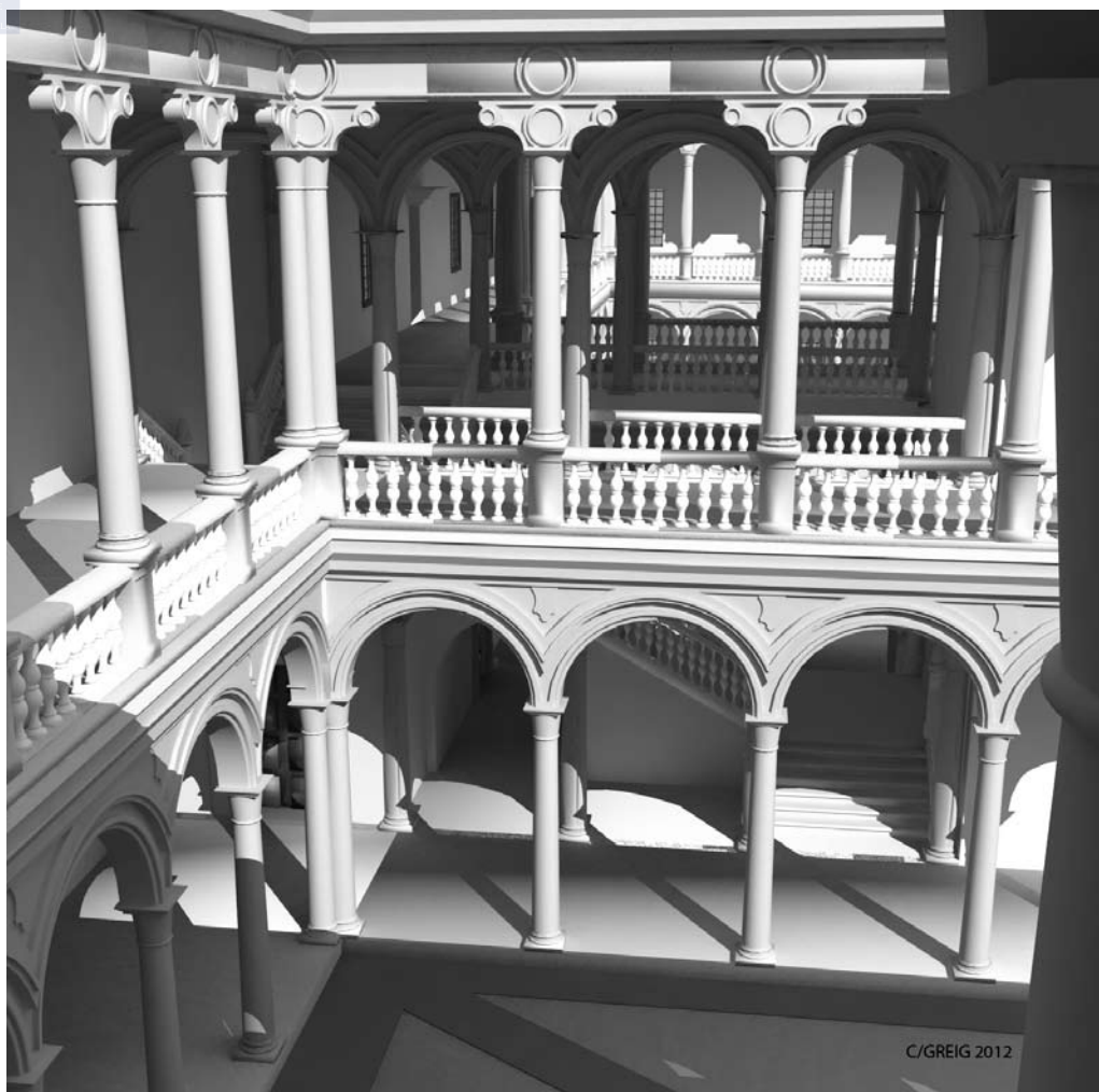
Fig. 4. Recreación virtual de la escalera del Alcázar de Madrid vista desde el patio del rey. Carmen García Reig, 2012. Departamento Ideación Gráfica Arquitectónica, Escuela Técnica Superior de Arquitectura de la Universidad Politécnica de Madrid

tamaño, hay un espacio en el cual han dispuesto la capilla y la escalera” ocupándose de describir detallada y organizativamente el acceso a la escalera principal del alcázar de la que afirma: “es común a los dos patios, puesto que de cualquiera de los dos soportales se suben unos pocos escalones que conducen a un rellano del cual parte la escalera para dividirse después en dos como abajo y terminar en las galerías superiores de ambos patios”. Finalmente alude a la distribución dual de los espacios regios: “En medio de la galería del patio de la mano izquierda, está la