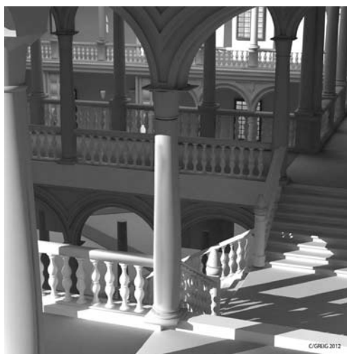
Fig. 6. Recreación virtual de la desembocadura de la escalera del Alcázar de Madrid. Carmen García Reig, 2012. Departamento Ideación Gráfica Arquitectónica, Escuela Técnica Superior de Arquitectura de la Universidad Politécnica de Madrid

En las recepciones del elenco cardenalicio al alcázar, Rodríguez Villa da habida cuenta de cómo "el cardenal enviaba a saber el día y hora en que podría tener audiencia con S. M. El día designado venía a Palacio acompañado de algunos caballeros de su séquito y familia; apeábase en el zaguán grande, subía por la escalera principal y pasaba por el cuerpo de guardia, donde