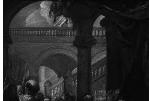
Fig. 2. Vista de la escalera del Alcázar de Madrid en la obra Festín de Herodes . Juan Carreño de Miranda, h. 1680. Museo del Prado

Años más tarde, del informe realizado por el gobernador Francisco de Luzón en 1548, se desprende una descripción minuciosa del acceso acodado al alcázar, mediante una doble puerta, ubicada en el extremo izquierdo de la fachada principal, dando entrada al patio "del rey" de unos 1120 m 2 , a través de un amplio zaguán de aproximadamente unos 300 m 2 . Nos habla de una escalera ya terminada "que sale a entrambos patios", cuyas gradas, balaustres y pasamanos están realizados en piedra berroqueña, procedente de las canteras de la sierra madrileña 21 .