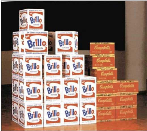
■ Lám. 1. Andy Warhol, Brillo Boxes (Soap Pads) and Campbell's Boxes (Tomato Juice) , 1964, Museum Ludwig, Colonia.