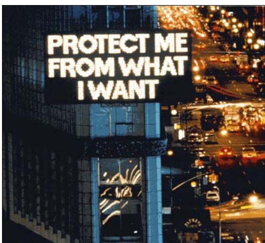
■ Lám. 9. Jenny Holzer, Survival , 1985-86.