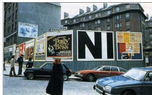
■ Lám. 6. Tania Mouraud, City Performance no. 1 (Paris) , 1978.