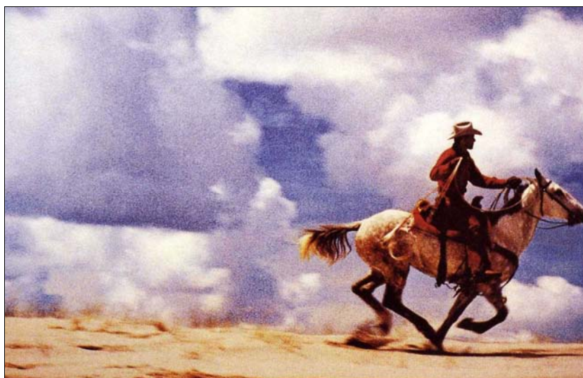
■ Lám. 12. Richard Prince, Sin título (cowboy) , 1989, Richard Prince.