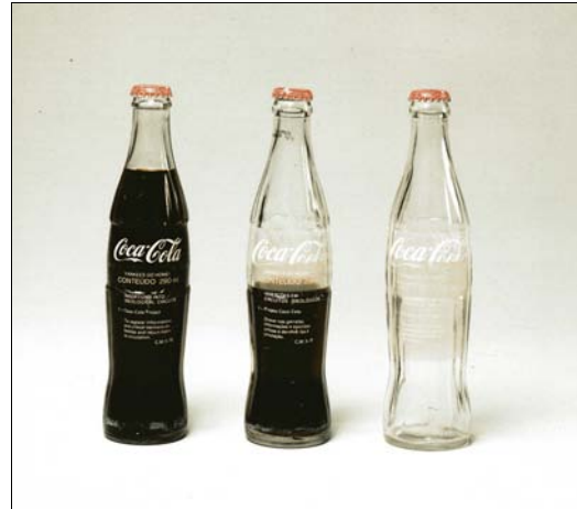
■ Lám. 2. Cildo Meireles, Inserções em circuitos ideológicos, Projeto Coca-Cola , 1970, Collection New Museum of Contemporary Art, Nueva York.