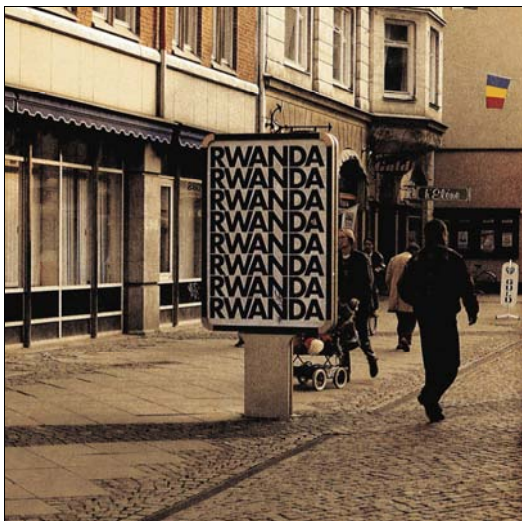
■ Lám. 7. Alfredo Jaar, Rwanda, Rwanda, 1994