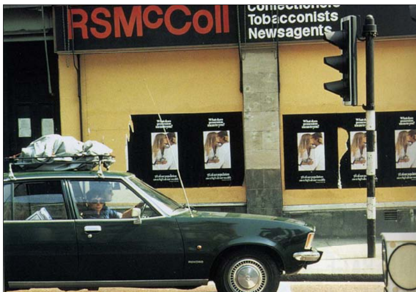
■ Lám. 11. Victor Burgin, Possession , 1976.