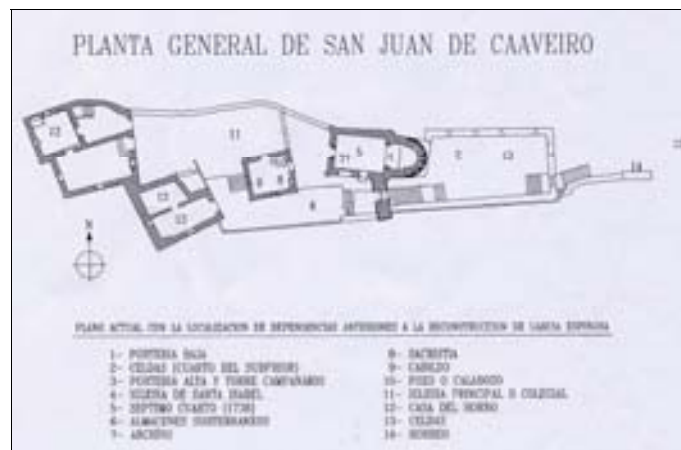
■ Fig. 2. Planta del monasterio. Fernando Sarmiento.