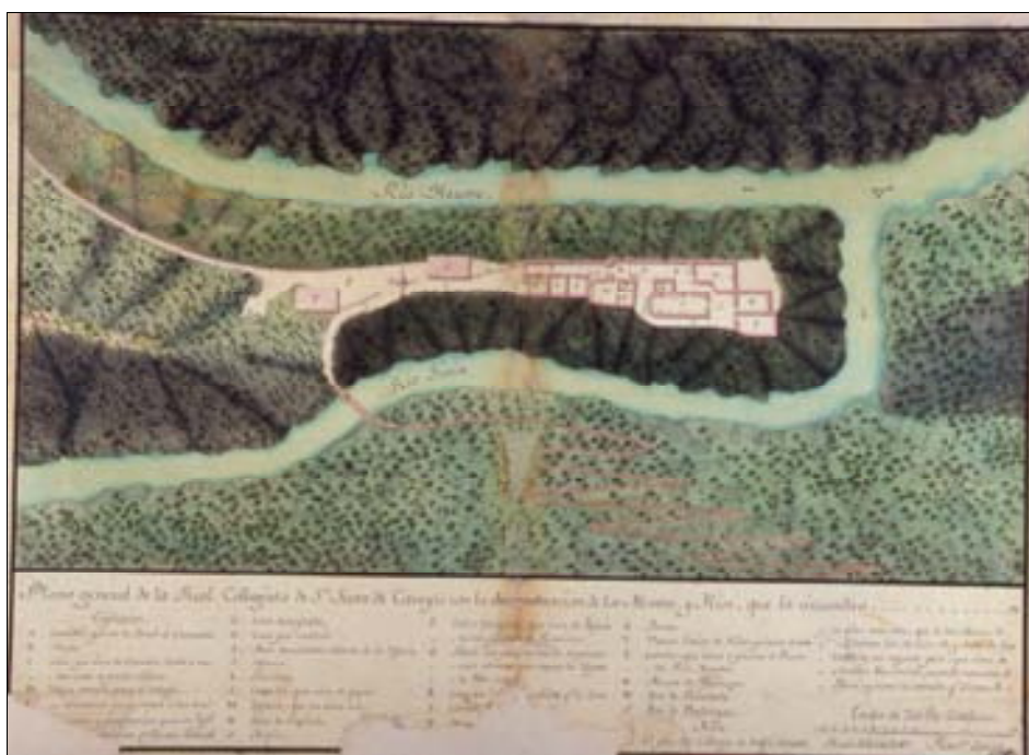
■ Fig. 4. Plano General de la Colegiata de San Juan de Caaveiro con los montes y ríos que la circundan. 1769. Francisco Solinis (A.H.N.).