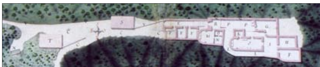
■ Fig. 5. Real Colegiata. Detalle de la planta. 1769. Francisco Solinis.