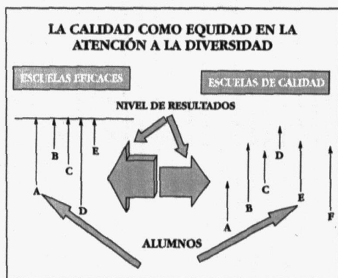
GRÁFICO I La calidad como equidad en la atención a la diversidad

En el caso de las escuelas eficaces los alumnos con diferentes niveles instructivos de partida deben llegar a un mismo nivel de conocimientos, de aprendizaje; en el caso de la calidad, los alumnos con diferente nivel de partida recorren diferentes tramos en función de sus posibilidades. Lo novedoso es que los alumnos pueden obtener mayor nivel de calidad con un menor nivel de aprendizaje (por ejemplo el alumno A de la derecha del gráfico tiene mayor calidad y menor nivel de aprendizaje que el alumno C). Con ello queremos rechazar la idea de la calidad ligada al elitismo y la exclusividad para entenderla como calidad equitativa.