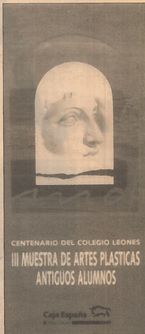
Programa de la exposición.