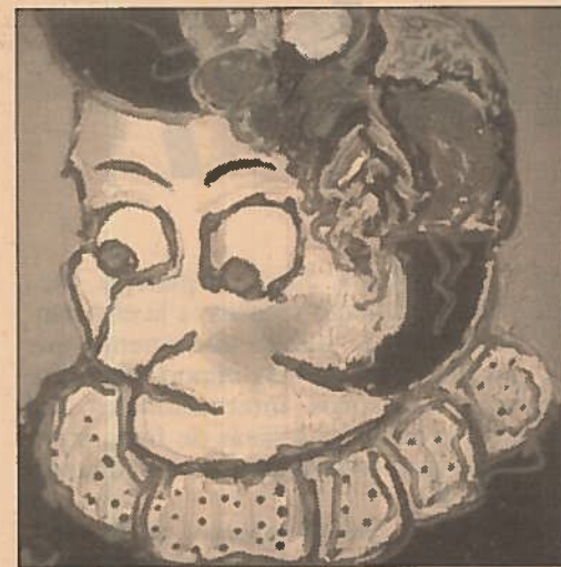
Obras de Enrique Barea ( Emboscada ), Manuel Rollán ( Hojas secas ), Antonio Redondo ( Familia: Madre ) y José Menchero ( Fortaleza ), cuatro de los once autores que expusieron.