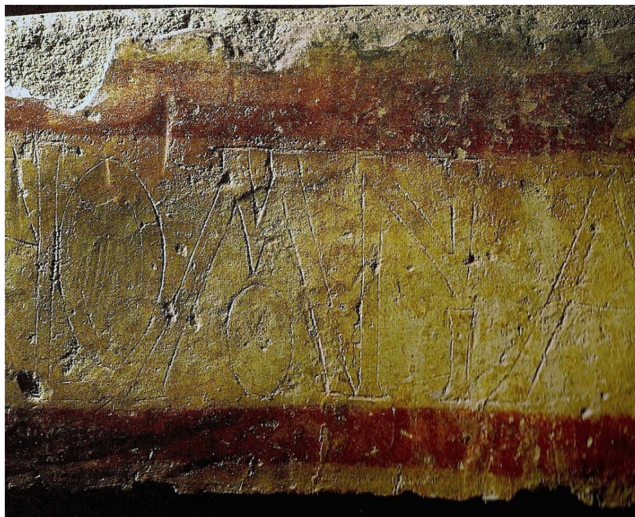
Figura 4 – Inscripción del abad Salomón y las reliquias de San Adrián, iglesia de Santiago, Peñalba de Santiago, León.

Se constata así, primeramente, la existencia de un nexo que une a las citadas personalidades, presentes todas en momentos fundamentales de la celebración memorial del santo bitino y personajes activos en las consagraciones realizadas en su honor. En segundo lugar, se documenta un interés expansionista de su culto hacia las regiones galaico-portuguesas, con el Bierzo como espacio intermedio cohesionador entre los confines del reino leonés y la capital.