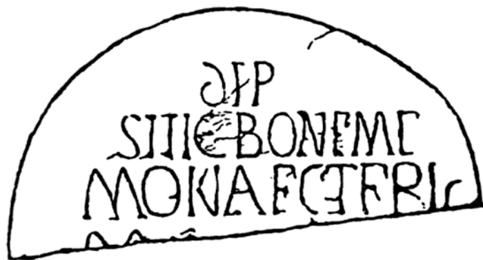
Figura 6 –Supuesta inscripción depositio de San Adrián, monasterio de San Félix y San Adrián, Chelas, Portugal (según Vilhena Barbosa, 1864).

A partir de la poca – por no decir nula – presencia de los mártires orientales en la documentación religiosa altomedieval y, sobre todo, en los antifonarios del contexto luso, todos estos testimonios tan sólo definen un proceso de invención de la memoria de San Adrián y Santa Natalia, a partir de su construcción sobre la documentación histórica y la realidad artística leonesa. Permaneciendo aún indemostrable la autenticidad del culto a estos mártires en la Lisboa de finales del siglo IX y menos su conexión con los templos de Tuñón y Boñar 77 .