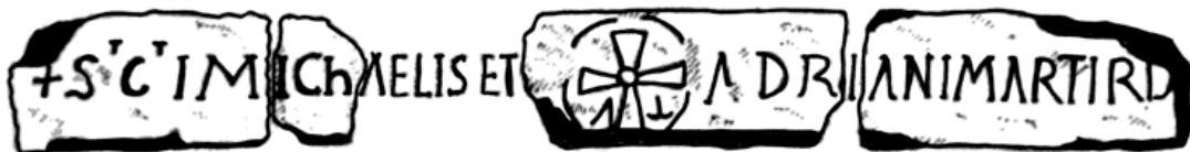
Figura 5 – Inscripción de San Adrián y San Miguel, Sintra, Portugal, Museu Arqueológico de Odrinhas.

El Museo Arqueológico de Odrinhas (Sintra, Portugal) custodia un epígrafe realizado sobre un bloque de formato horizontal y que se considera procedente de Faião. Concebido quizás como dintel de un acceso, la inscripción que porta dice: S(an)C(t)I MICH[AELIS ET] ADR[I]ANI MARTIRIS 65 (figura 5).