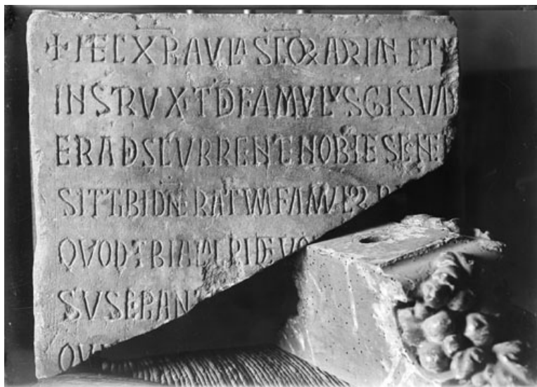
Figura 3 – Epígrafe de consagración de la iglesia de San Adrián La Losilla, León (desaparecido).