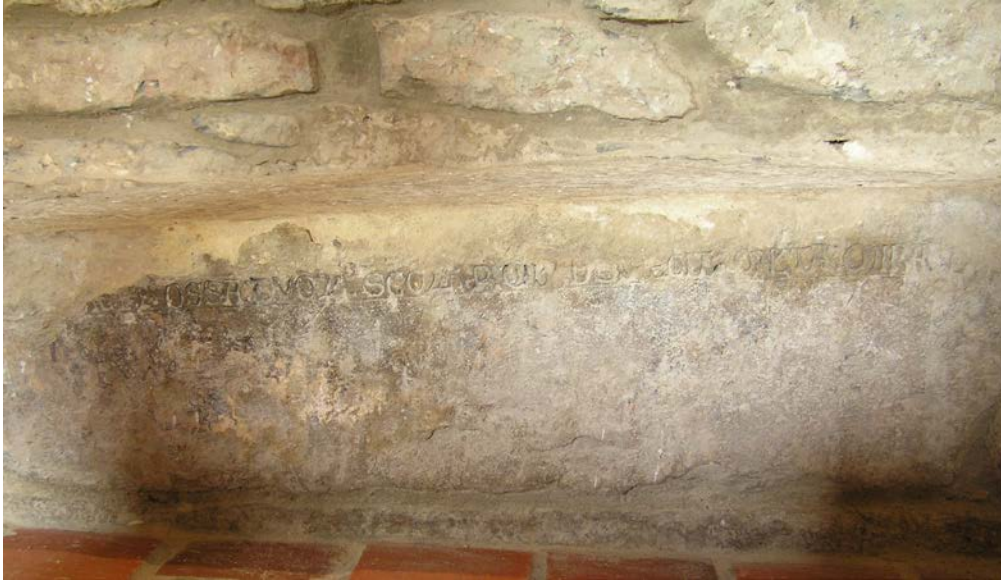
Figura 7 – Epitafio sepulcral en el arca de piedra de San Adrián y Natalia, iglesia de Nuestra Señora de la Somerada, León.

La fórmula “ Hic iacet ” con la que se inicia el epígrafe lo convierte en un simple epitaphium sepulcrale 92 , mientras que la expresión “ per quibus Dominus fecit multa miracula ”, pone el acento en la presencia de los huesos santos 93 (figura 8).