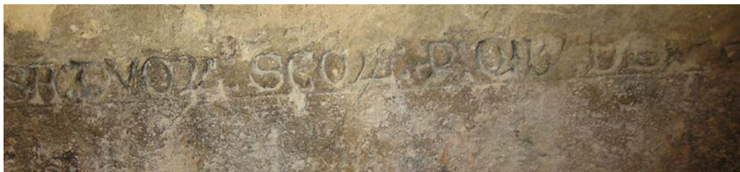
Figura 8 – Detalle del epitafio sepulcral en el arca de piedra de San Adrián y Natalia, iglesia de Nuestra Señora de la Somerada, León.

La fórmula “ Hic iacet ” con la que se inicia el epígrafe lo convierte en un simple epitaphium sepulcrale 92 , mientras que la expresión “ per quibus Dominus fecit multa miracula ”, pone el acento en la presencia de los huesos santos 93 (figura 8).