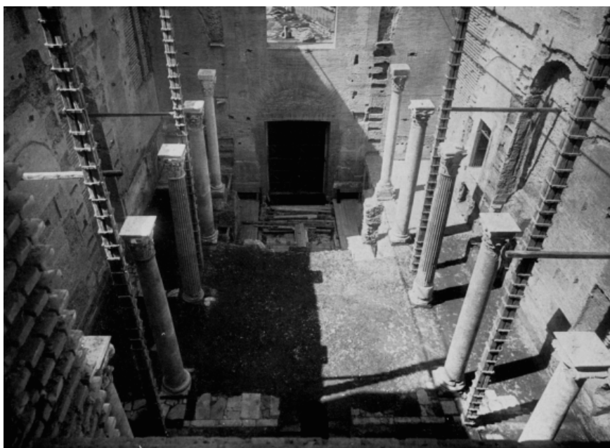
Figura 1 – Curia Julia e iglesia de San Adrián, Roma, foros imperiales.

Si difusos son los orígenes históricos que aclaren las fechas de su condena, martirio, traslado a Bizancio y desde allí, a Roma, el vacío arqueológico en torno a un posible establecimiento arquitectónico o memoria martirial en Oriente es total 17 . Al contrario, en este lagunoso proceso de construcción memorial de la figura del santo, la ciudad de Roma se perfila como punto esencial. Durante el pontificado de Honorio I (615-638) se tiene noticia de la construcción del primer monumento en su memoria, cuando la Curia Julia del foro romano fue transformada en templo cristiano (figura 1).