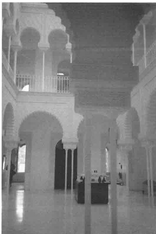
Lámina 3. Torre Aguas. Enrique Figueras, 1890.