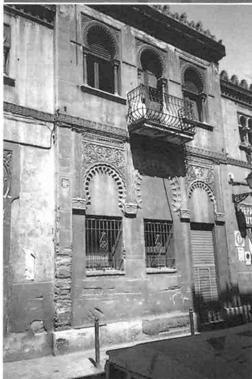
Lámina 4. Chalet del Moro. José Graner Prat, 1898.