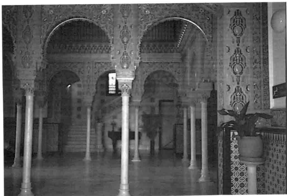
Lámina 5. Casa Marsans. Julio Mariné, 1907.