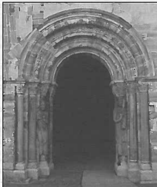
Fig. 3: Restitución digital de la portada románica del monasterio de Santa María de Carracedo, León, según los autores.

Consideramos que, ante estas precisiones, la portada desaparecida podría restituirse digitalmente de este modo (Fig. 3). Estuvo formada por tres arquivoltas que apeaban en seis columnas, dos de ellas, con las imágenes frontales y rígidas del rey, a la izquierda, y el abad, a la derecha 20 . Valentín Cardera las definió como “momias fajadas” 21 y Gómez-Moreno las calificó de “arte atrasadísimo” pero “libre de prejuicios de escuela, recordando algo las imágenes de la puerta lateral de San Vicente de Ávila” 22 .