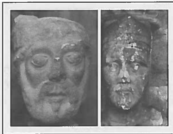
Fig. 5: Cabezas románicas del monasterio de Santa María de Carracedo, León y de la portada occidental de la abadía de Saint Denis, París, 1138-1160

Nuestra pequeña aportación ha supuesto un primer acercamiento a esta portada desaparecida. Mediante las fuentes hemos podido ubicarla en el crucero del templo monástico y concretar su morfología, aunque no contemos con todos los elementos que la compusieron. El estudio de estas estatua-columna contribuye a afianzar el conocimiento de la escultura a mediados del siglo XII, sus relaciones con Francia y el papel de la realeza y del clero en la promoción de obras artísticas.