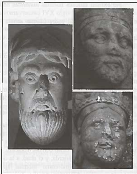
Fig. 4: Cabezas románicas de la catedral de Astorga y del monasterio de Santa María de Carracedo, 1138-1160

Por lo tanto, Constanza era conocedora de la protección que su padre Alfonso VII y su tía estaban dando a Carracedo. En consecuencia, pudo ser partícipe de las necesidades artísticas que la obra carracetenense conllevaba. El monasterio berciano, mediante la escultura de su portada, participaba ahora en la misma renovación artística documentada en Astorga. Las estatuas-columna del rey y el abad, por su cercanía formal, comparten la misma línea estilística con el que los especialistas franceses han denominado el Maestro de los Patriarcas, presente en las arquivoltas de la portada occidental de Saint Denis 29 (Fig. 5). Sin embargo,