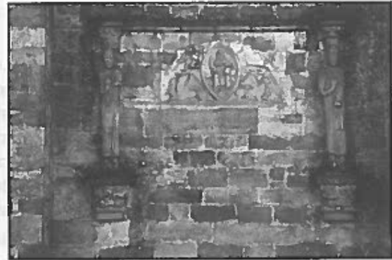
Fig. 1: Vestigios de la portada románica, 1138-1160, monasterio de Santa María de Carracedo, León