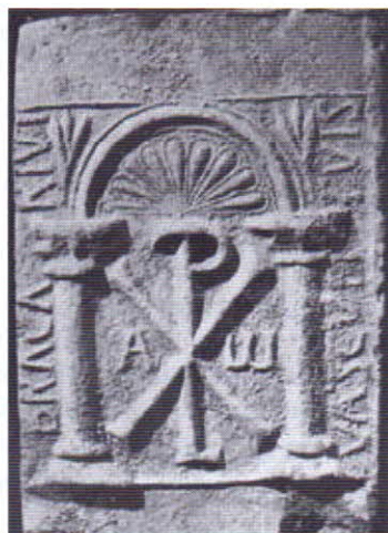
Fig. 4. Placa nicho. Mérida, Museo Romano