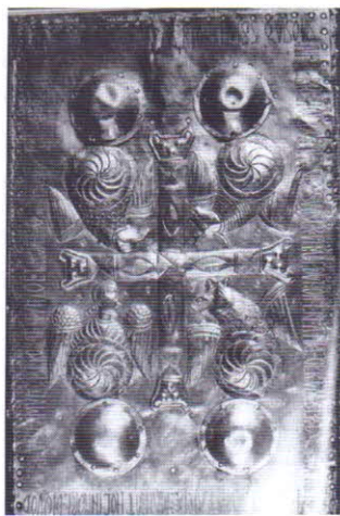
Fig. 2. Cruz y baldaquino. Oviedo, iglesia de San Julián de los Prados