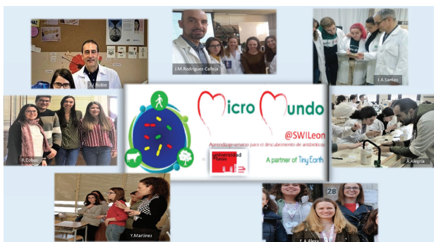
Instructores/as MicroMundo en la Universidad de León, curso 2019-20.

3 Departamento de Biología Celular y Molecular, Universidad de Uppsala (Suecia).