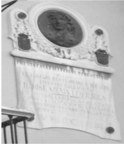
Foto realizada por la autora de la placa conmemorativa que se encuentra en la actual Plaza de San Antonio de Cádiz 22

diputado, y el posterior testamento conferido por su primer albacea), José Mexía, nos muestra una imagen de su propia vida y de su muerte: su lugar de origen, edad y estado civil, siendo éste uno de los datos más cuestionados; su situación económica, el papel social que jugó, los lazos familiares, profesionales, de amistad...., todo ello, espejos que reflejan la visión que el diputado tenía de lo que hasta entonces había sido su trayectoria vital, y cómo se acercaba el final de ésta.