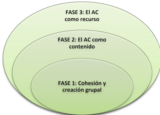
Figura 1.- Fases del Ciclo del AC (Fernández-Río, 2017, p. 245)

El AC es una metodología en auge en los últimos años y con suficiente evidencia científica a sus espaldas, en diferentes áreas y etapas educativas, para ser un modelo pedagógico a considerar en cualquier intervención educativa. No obstante, su implementación y puesta en práctica no es un trabajo fácil (Velázquez, 2013). Los autores Martínez-Benito y Sánchez (2020) describen los problemas más comunes con los que se encuentra el profesorado a la hora de llevar a la práctica este modelo pedagógico: (1) falta de experiencia y habilidades del alumnado, (2) experiencias negativas previas, (3) falta de formación del profesorado, (4) problemas de organización a nivel de centro y aula, (5) oposición familiar, (6) falta de control del aula y (7) actitud o expectativas del cuerpo docente.