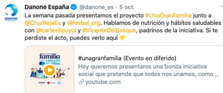
Figura 6. DANONE en redes sociales