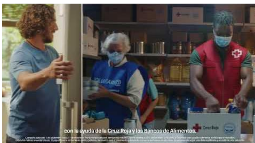
Figura 4. Captura del spot publicitario de Una Gran Familia de DANONE.

Fuente: [https://www.youtube.com/watch?v=pYLjC1UBBCM], a fecha 25/10/2020