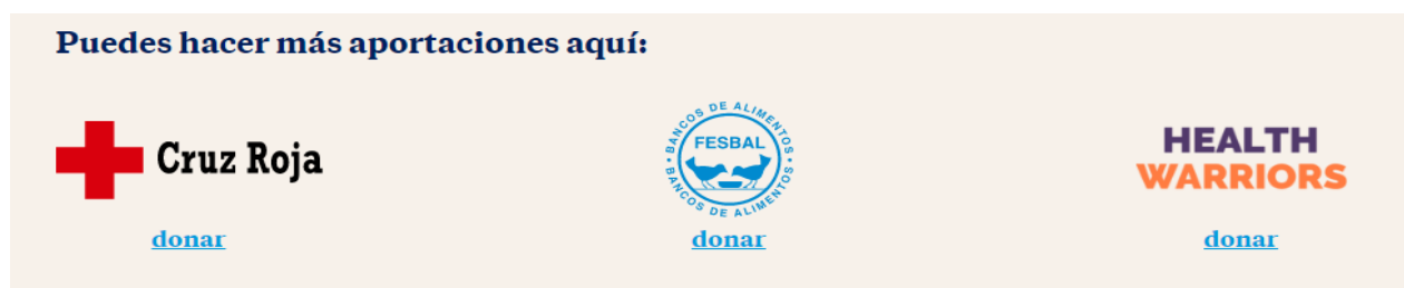
Figura 3. Captura de la página web Una Gran Familia de DANONE.

Fuente: [https://unagranfamilia.danone.es/], a fecha 24/10/2020