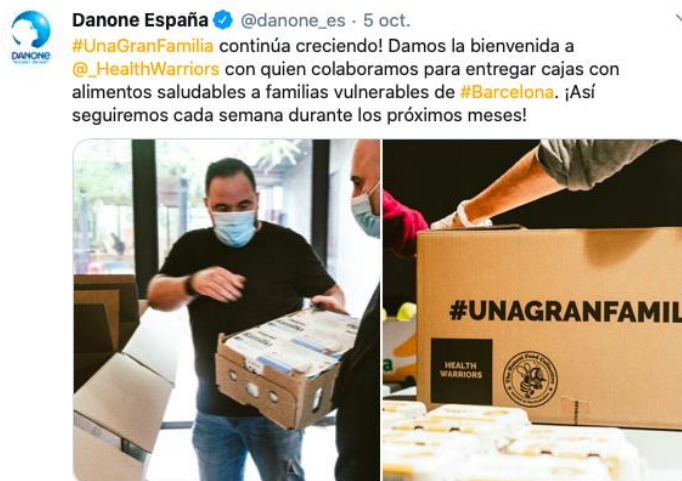
Figura 5. DANONE en redes sociales