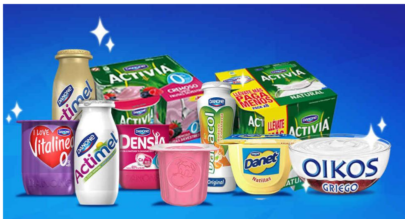
Figura 1. Foto productos Danone.