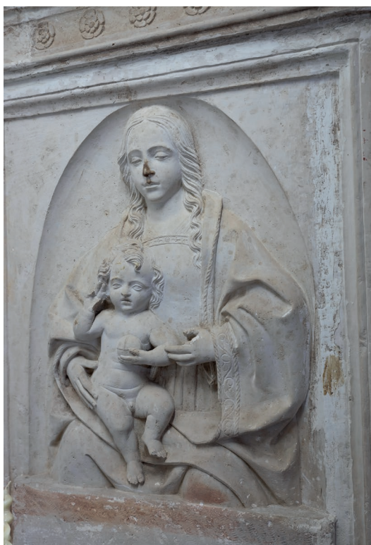
▪ Fig. 9. Vasco de la Zarza. Relieve de la Virgen con el Niño. Principios del siglo XVI.

el Niño en su regazo, que bendice al finado y constituye –junto al yacente– la parte más refinada del conjunto (Fig. 9). Resulta significativa la posición de esta imagen, que habitualmente se situaba en el fondo del arcosolio sobre el bulto del difunto, como aparece en otros sepulcros castellanos contemporáneos, como el del Gran Cardenal en la Catedral de Toledo o el de Baltasar del Río, en la iglesia mayor de Sevilla. La obra recuerda los bajorrelieves dedicados a este tema durante el Quattrocento y principios del Cinquecento en tumbas centroitalianas, como los realizados por Antonio Rossellino, Desiderio da Settignano, Andrea della Robbia y, especialmente, los de Mino da Fiesole, cuya producción artística se hizo eco en algunos proyectos de Zarza. Entre las creaciones de da Fiesole destacan la Madonna Arrighi , que custodia el Museo del Louvre, o la que actualmente se conserva en el Metropolitan Museum of Art de Nueva York (Fig. 10), con