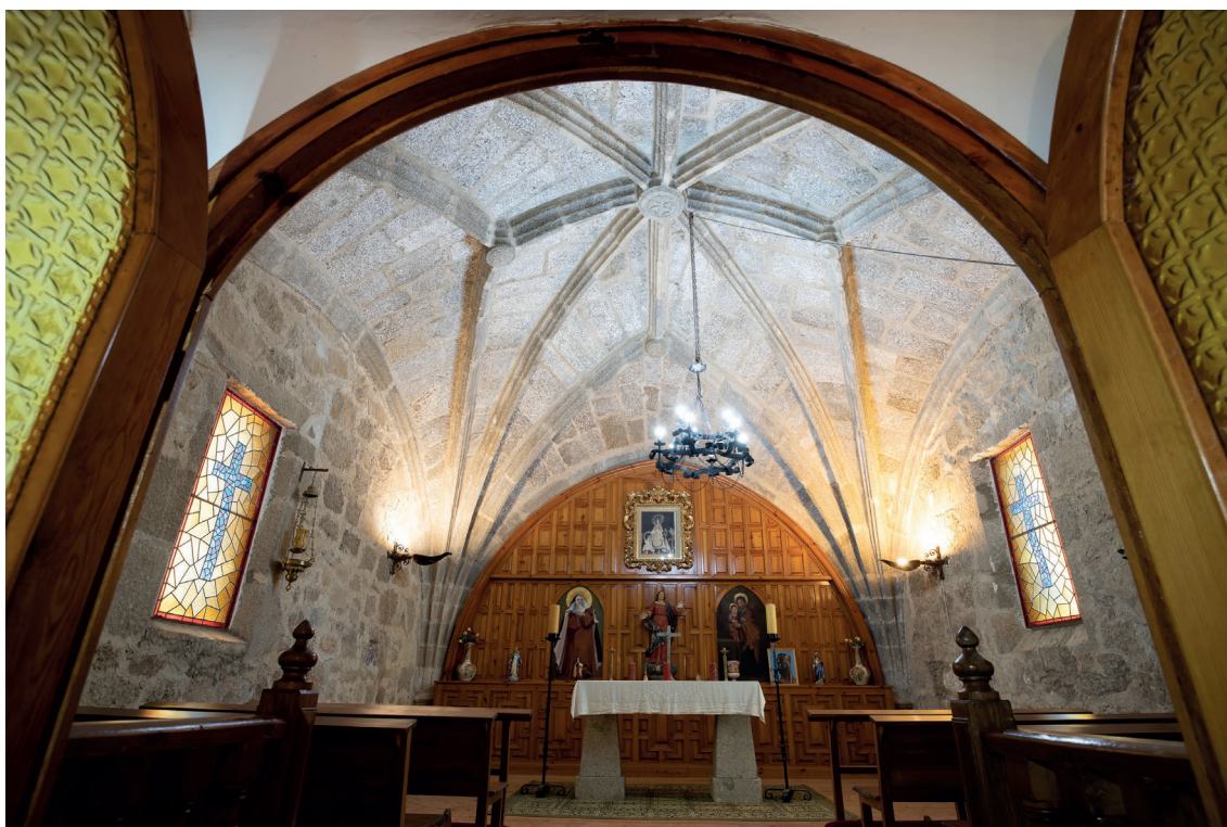
▪ Fig. 4. Bóveda de la cabecera. Fines del siglo XV-principios del XVI.

tuvo una amplia difusión en Ávila desde la construcción del Monasterio de Santo Tomás de Ávila, levantado según las trazas de Juan Guas entre las décadas de 1480 y 1490 25 . Su predicamento en los decenios posteriores se observa, por ejemplo, en el Santuario de Nuestra Señora de Sonsoles, obra de Martín de Solórzano 26 , así como en la parroquial de