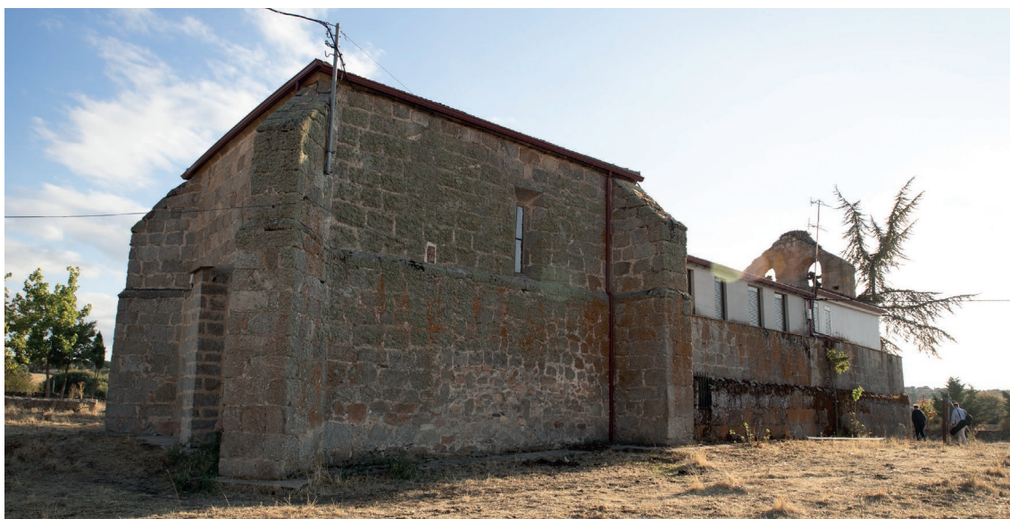
Fig. 2. Vista de la iglesia de Serranos de la Torre desde la cabecera. Fines del siglo XV-principios del XVI.

sia y el castillo actualmente se encuentran en una de estas parcelas. Hacia los años 70 del siglo pasado la iglesia había sido transformada. La reforma mantuvo los muros, la bóveda del presbiterio y la espadaña, por lo que el aspecto exterior de la construcción no fue alterado de manera significativa, aunque el tejado de la nave fue reconstruido.