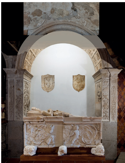
▪ Fig. 6. Vasco de la Zarza. Recreación ideal del monumento fúnebre de Bernaldino de Barrientos a partir de los restos conservados en la iglesia de Serranos de la Torre y el Museo de Ávila.

del templo de don Bernaldino, por lo que ambos proyectos podrían deberse al mismo maestro de obras.