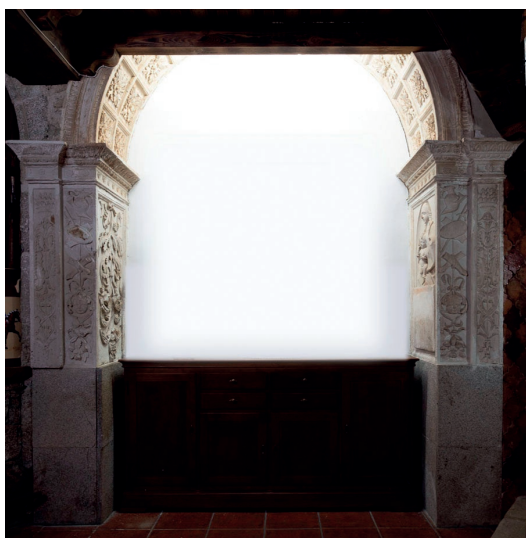
▪ Fig. 5. Vasco de la Zarza. Arcosolio del monumento fúnebre en su estado actual. Principios del siglo XVI.