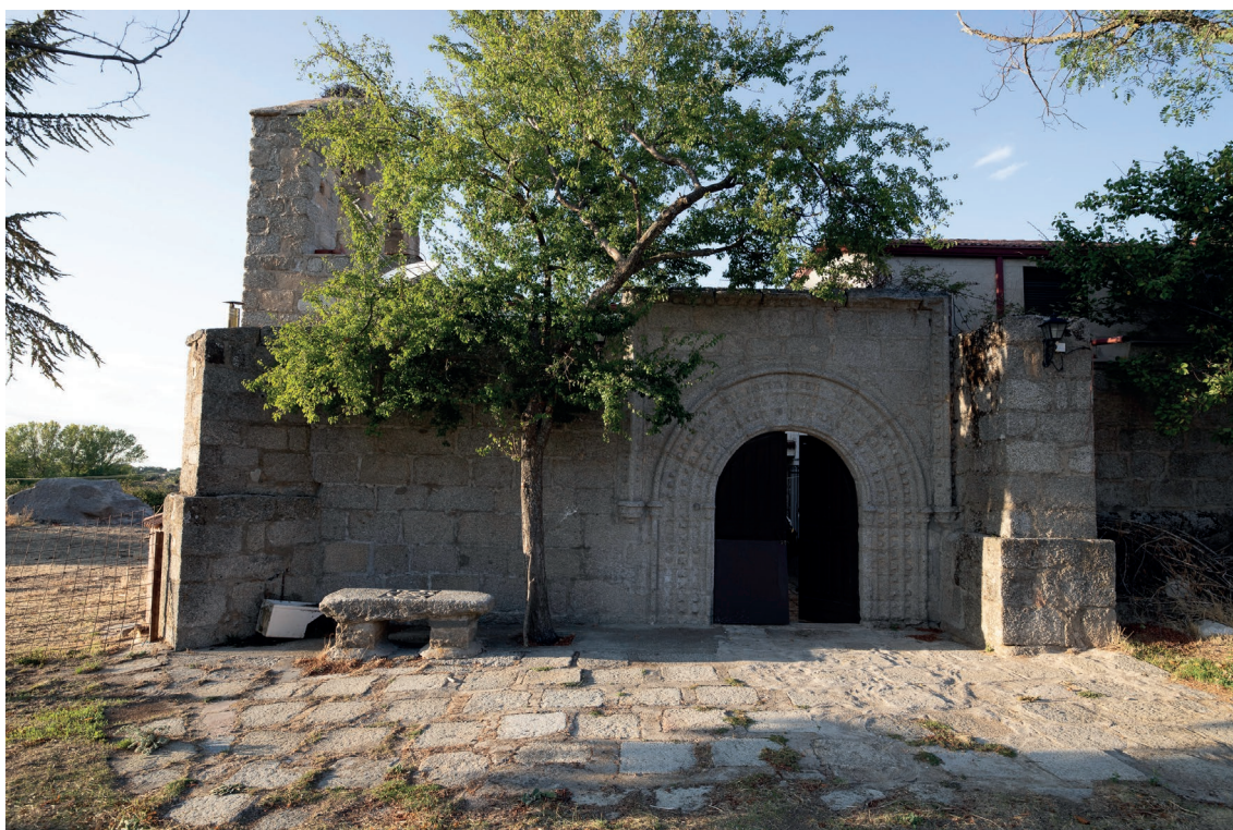
▪ Fig. 3. Vista parcial de la fachada sur. Fines del siglo XV-principios del XVI.

portada de la iglesia antigua de Cebreros, que luce el escudo del obispo abulense Francisco Sánchez de la Fuente, cuyo episcopado se extiende de 1493 a 1496 23 , lo que permite datar la obra cebrerense en esos años. Esta creación fue imitada –ya en el siglo XVI– en las cercanas parroquias de los municipios de El Herradón de Pinares y San Bartolomé de Pinares. Un diseño parecido encontramos en la portada de la iglesia de San Juan –en la ciudad de Ávila–, que forma parte del proyecto de reconstrucción de la nave principal que se encargó a Martín de Solórzano en 1504 24 . En los ejemplos citados la puerta está flanqueada por contrafuertes, unidos en la parte superior por un guardapolvo, de