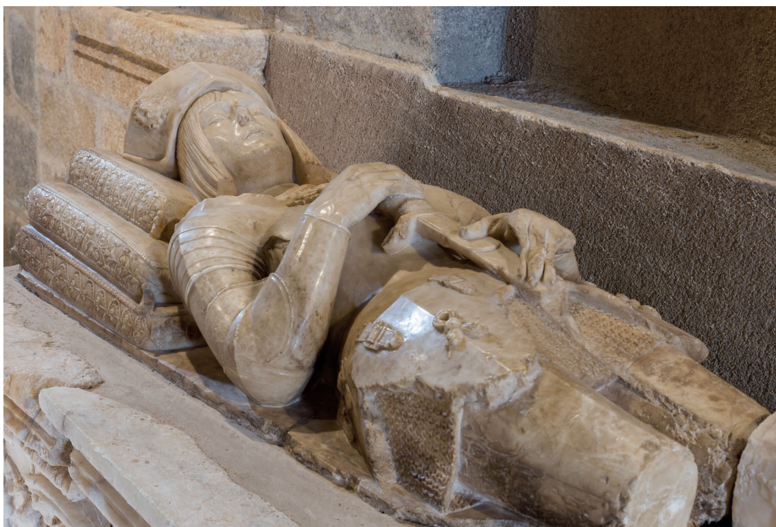
▪ Fig. 11. Vasco de la Zarza. Detalle del yacente. Principios del siglo XVI.

el retablo de la capilla funeraria de Alonso Castrillo en la iglesia de Ampudia (Palencia).