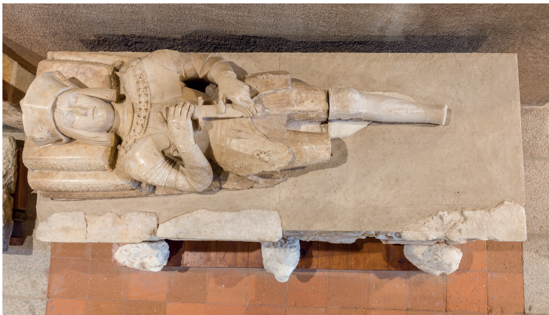
▪ Fig. 8. Vasco de la Zarza. Vista cenital del yacente. Principios del siglo XVI.

vertical 34 , pero el esquema utilizado en la obra que nos ocupa solo fue empleado en Serranos. Esta obra sigue un modelo de gran arraigo en la escultura funeraria castellana, que se adaptó a la estética renacentista. El conjunto formado por la cama sepulcral y el bulto mide 2,06m de largo, 0,98m de alto y 0,79 de ancho. El arcosolio presenta 3,55m de alto por 2,85m de ancho. Se levanta sobre dos pilastras con decoración a candelieri que incluye motivos vegetales, trofeos militares y putti , repertorio ornamental característico de la producción artística de Vasco de la Zarza. Teniendo en cuenta otras estructuras similares diseñadas por nuestro artista, creemos que las pilastras se pudieron coronar con un flamero o -más probablemente- con las armas del finado, de las que no se ha conservado ningún resto en el sepulcro. Las cornisas de las pilastras han sufrido un gran de-