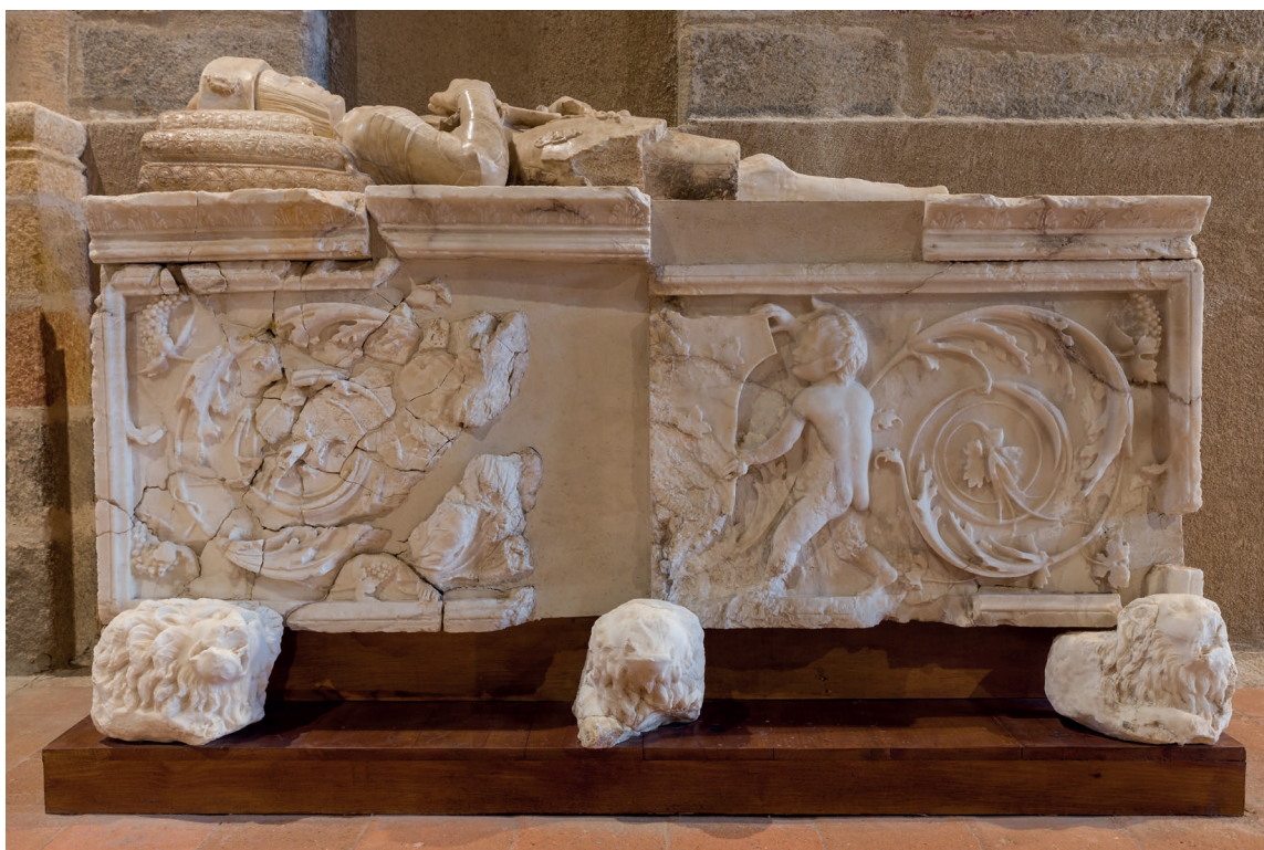
▪ Fig. 7. Vasco de la Zarza. Yacente y cama sepulcral expuestos en el almacén visitable del Museo de Ávila. Principios del siglo XVI.

el sepulcro. La causa pudo ser el estado de ruina de la iglesia –del que dejó constancia-, lo cual quizá impidió el acceso a la misma.