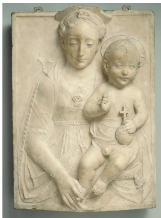
▪ Fig. 10. Mino da Fiesole. Virgen con el Niño. Metropolitan Museum of Art, Nueva York. Circa 1471-74.

el Niño en su regazo, que bendice al finado y constituye –junto al yacente– la parte más refinada del conjunto (Fig. 9). Resulta significativa la posición de esta imagen, que habitualmente se situaba en el fondo del arcosolio sobre el bulto del difunto, como aparece en otros sepulcros castellanos contemporáneos, como el del Gran Cardenal en la Catedral de Toledo o el de Baltasar del Río, en la iglesia mayor de Sevilla. La obra recuerda los bajorrelieves dedicados a este tema durante el Quattrocento y principios del Cinquecento en tumbas centroitalianas, como los realizados por Antonio Rossellino, Desiderio da Settignano, Andrea della Robbia y, especialmente, los de Mino da Fiesole, cuya producción artística se hizo eco en algunos proyectos de Zarza. Entre las creaciones de da Fiesole destacan la Madonna Arrighi , que custodia el Museo del Louvre, o la que actualmente se conserva en el Metropolitan Museum of Art de Nueva York (Fig. 10), con