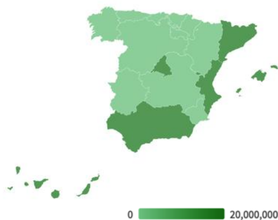
Figura 7. Mapa del número de turistas en España durante 2020 en los primeros ocho meses (en millones)