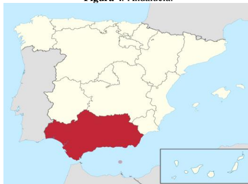
Figura 4. Andalucía.