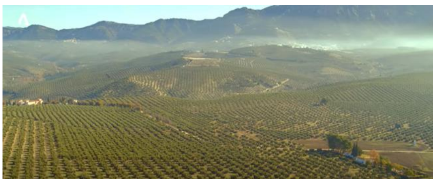
Figura 1. Paisaje de Andalucía