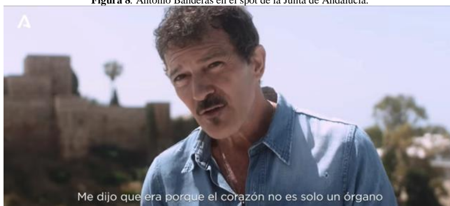
Figura 8. Antonio Banderas en el spot de la Junta de Andalucía.