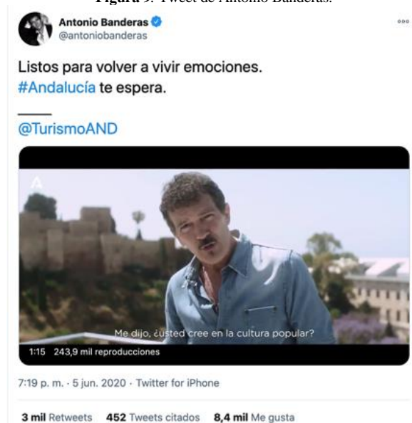
Figura 9. Tweet de Antonio Banderas.