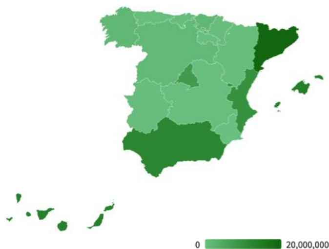
Figura 6. Mapa del número de turistas en España durante 2019 (en millones)