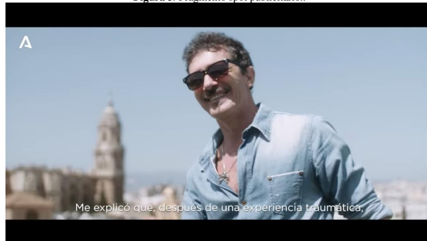
Figura 3. Fragmento spot publicitario..

SPOT ANTONIO BANDERAS - Campaña turística de Andalucía verano 2020. 05-06-20