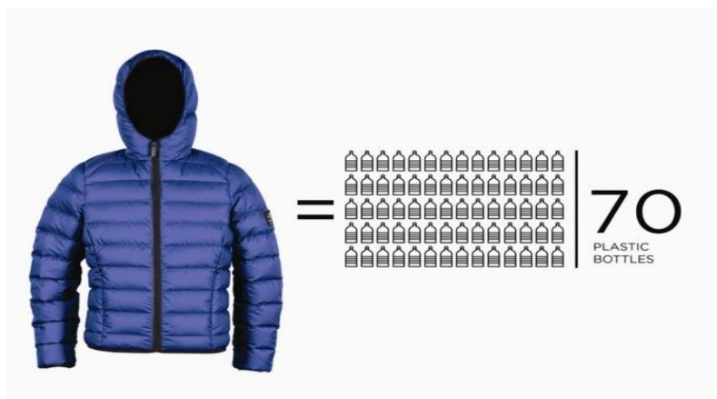
Figura 30. Utilización de plástico para la fabricación.