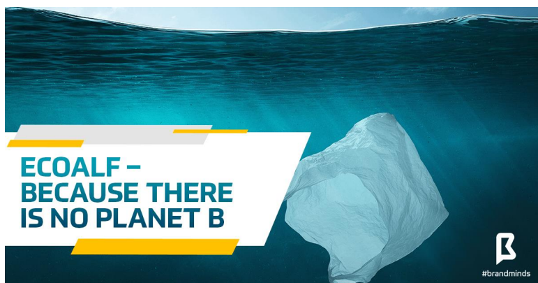
Figura 32. Imagen de uno de los lemas de Ecoalf que refleja su compromiso con la retirada de plástico de los océanos.