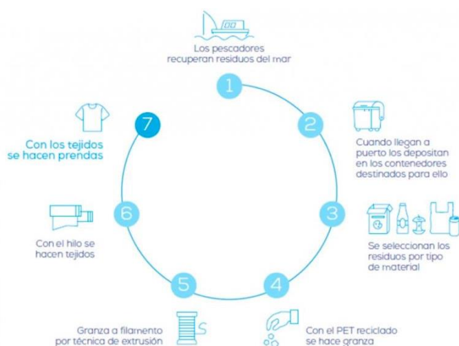
Figura 33. Proceso de producción de la empresa Ecoalf.