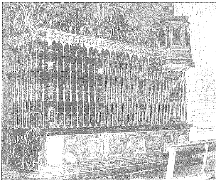
Lám. 2. Detalle del cancel