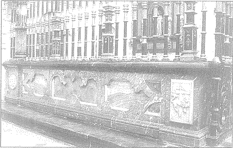
Lám. 3. Detalle del pedestal