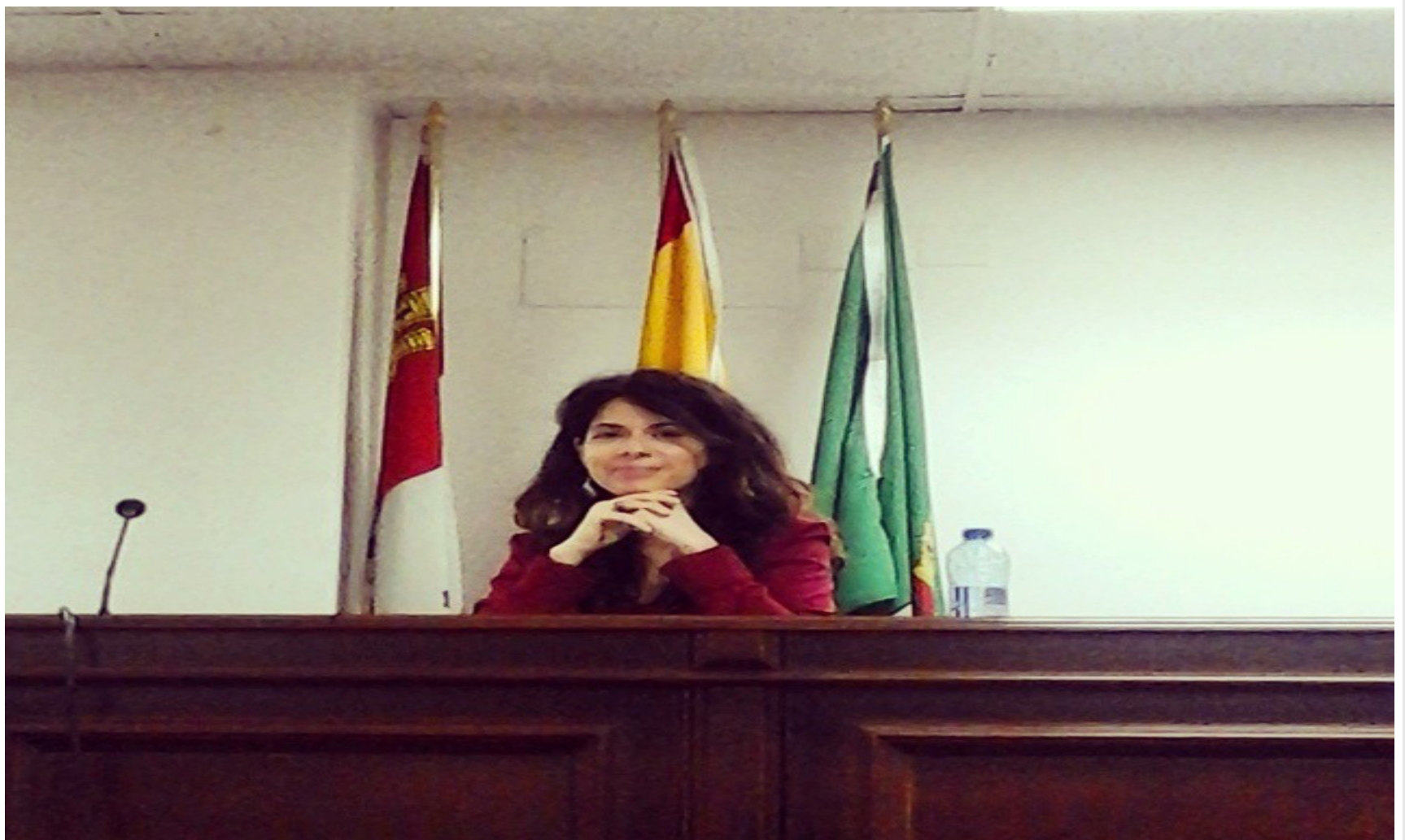
Rosa Díez Cobo. Guapa, guapa, guapa.