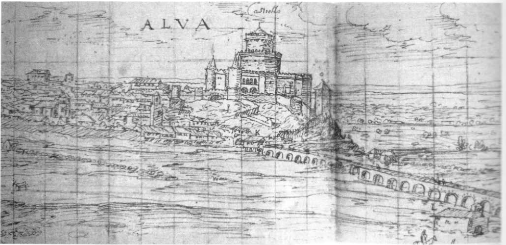
6. Alba de Tormes. Dibujo de Wyngaerde.