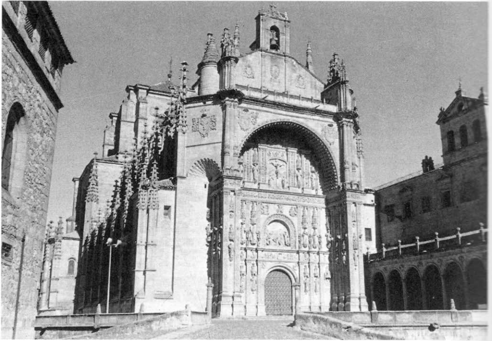
5. Iglesia de San Esteban. Salamanca.