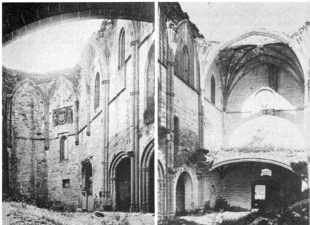
1 y 2. San Leonardo, de Alba de Tormes (fotografías de principios de siglo).