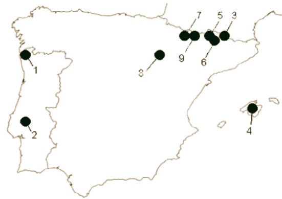
Figura 3. Distribución de D. geminata en la Península Ibérica y Baleares. 1: ZIMMERMANN (1909). 2: DA SILVA (1946) (fósil). 3: MARGALEF (1952). 4: MARGALEF (1953). 5: DOSSET (1888) y MARGALEF (1956). 6: VILASECA (1978). 7: CAMBRA (1987). 8: CAMBRA (1989). 9: URS (2006). Únicamente esta última referencia se asocia a crecimientos masivos.

Entre los medios de dispersión propuestos para las diatomeas cabe citar: la anemocoria de las formas de resistencia, la zoocoria o propagación debida a aves, insectos y peces migradores o introducidos, y la introducción involuntaria (vertido de aguas de acuarios, embarcaciones, aparejos de pesca, etc.). En el caso de D. geminata , la dispersión de esta especie fuera de su área de distribución original se debe con toda probabilidad a vectores humanos (KILROY et al. , 2005). Las actuales estrategias de gestión contemplan generalmente medidas restrictivas respecto al uso recreativo del agua en las zonas infestadas. Estas diatomeas pueden resistir varios días fuera del agua, adheridas a botas, redes, etc., lo que favorece su capacidad de dispersión. Por ejemplo, las autoridades neocelandesas imponen severas sanciones contra la propagación voluntaria de este alga, medida que ha conseguido confinar su distribución a las cuencas de