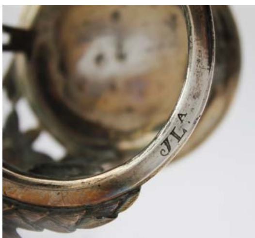
▪ Fig. 4. Portavinagreras. Francisco Iturralde, 1796. Madrid, Colección particular. Iniciales del propietario.

En el año 1797 está marcada la pareja de portapaces con Ecce Homo y Virgen con el Niño de Obanos 24 . Marca de 1798 lleva el relicario, de tipo sol, de Santo Tomás, titu-