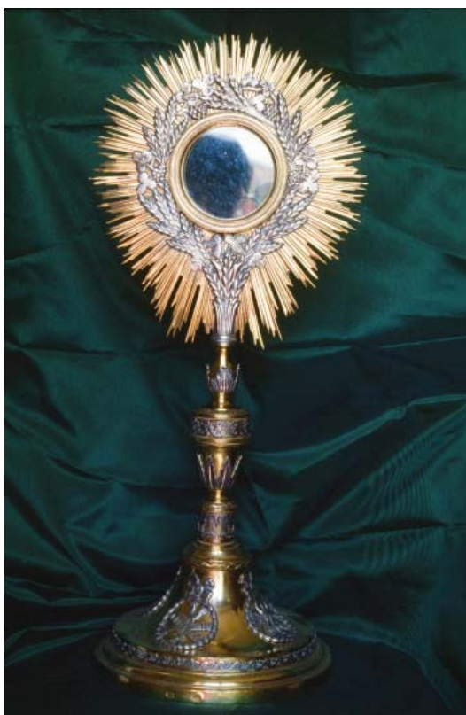
▪ Fig. 7. Custodia. Francisco Iturralde, ¿1812/1816?. Mues, iglesia parroquial. Foto de la autora.

Un caso peculiar es el de la custodia de Mues (Fig. 7) que lleva sólo la marca de artífice (Fig. 8), como la de las piezas precedentes. En las cuentas tomadas el 9 de febrero de 1841 (correspondientes a los dos años anteriores) se anota la siguiente partida de descargo: “Iten de veinte y un reales de plata fuertes, los mismos se pagaron por el cambio de custodia, que valen más la que traje que la que se dio” 38 . La custodia es de bronce dorado con sobrepuestos de plata como las anteriores. Lo mismo que otras de Iturralde, tiene espigas y racimos alrededor del viril, además de prolongadas ráfagas de muchos