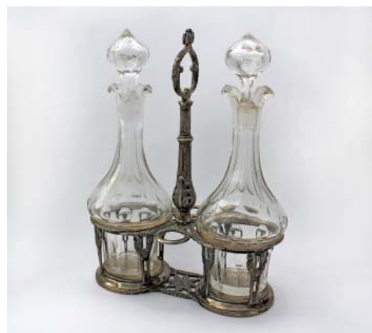
• Fig. 1. Portavinagreras. Francisco Iturralde, 1796. Madrid, Colección particular.

laurel que se anuda al pie del vástago entre los anillos para dejar los tapadores de las botellas de cristal que se han conservado completas. El vástago se sitúa, de manera inusual, perpendicularmente a los pocillos; abalaustrado, con estrías y hojas de acanto, remata en una anilla con laurel y lazo como en su base. Los pocillos se unen abajo mediante una flor de ocho pétalos 23 (Figs. 1-4).