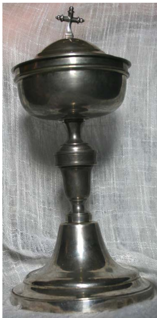
▪ Fig. 5. Copón. Francisco Iturralde, 1816. Legaria, iglesia parroquial.