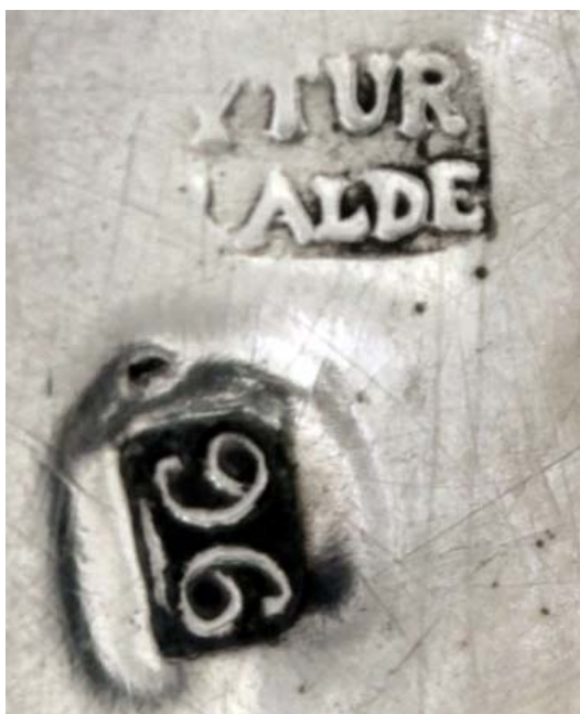
▪ Fig. 3. Portavinagreras. Francisco Iturralde, 1796. Madrid, Colección particular. Marcas de artífice y cronológica.