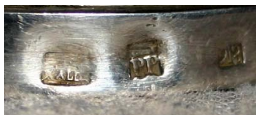
▪ Fig. 6. Copón. Francisco Iturralde, 1816. Legaria, iglesia parroquial. Marca de artífice, localidad y cronológica.

del Arte de la Universidad Complutense de Madrid, a quien debo estas noticias, que han sido comprobadas en un viaje reciente en 2014, donde hemos fotografiado la pieza y su marca.