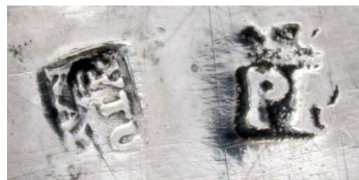
• Fig. 2. Portavinagreras. Francisco Iturralde, 1796. Madrid, Colección particular. Marcas de artífice y localidad.