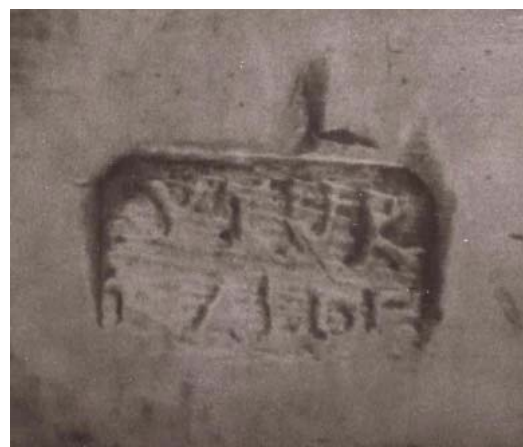
▪ Fig. 8. Custodia. Francisco Iturralde, ¿1812/1816?. Mues, iglesia parroquial. Marca de artífice.

rayos. En los sobrepuestos del pie se adorna con pelícano con crías, corona de espigas, vergajo, cruz, caña con esponja y lanza, cordero apocalíptico y columna, gallo, dados, INRI y escalera. Resulta coincidente en material, dimensiones, tipo y motivos iconográficos con las de Barbarin, Ganuza y Andosilla y pensamos que con el mismo diseño y moldes se pudieron fabricar algunas custodias que no se llevaron al marcador y que se vendieron luego a iglesias que las necesitaban. Es probable que la custodia de Goñi, que tampoco lleva marca cronológica 39 , sea un ejemplar en las mismas circunstancias. Como luego se explica, esta variante de la marca, que corresponde a Francisco Iturralde, está documentada hasta 1816.