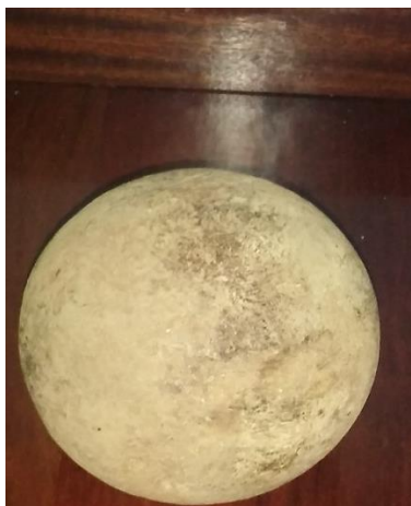
Imágenes 12 y 13: bola actual y bola de antaño.