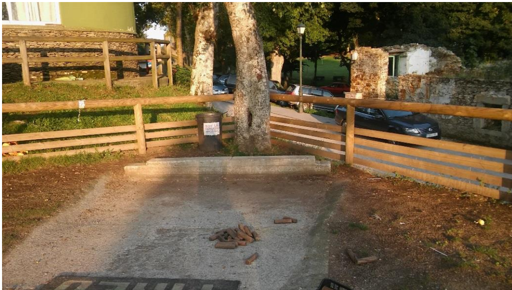
Imagen 20: "Poya" de la bolera infantil.