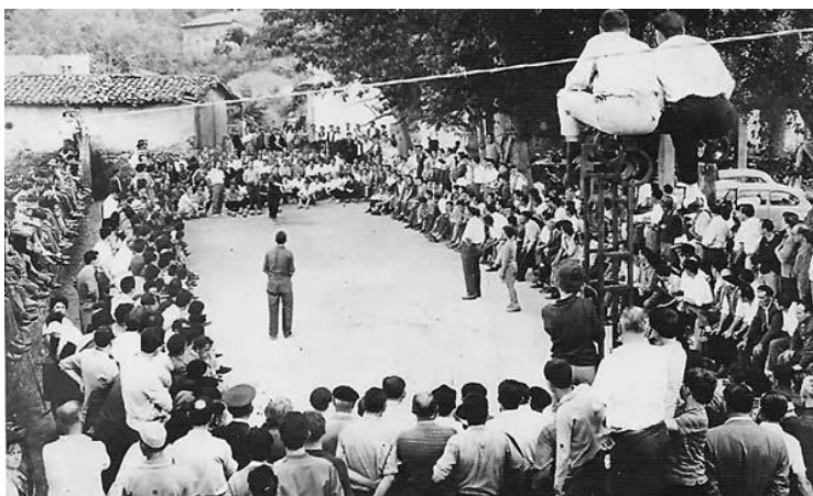
Imagen 6: Partida en 1908. (Mencía Martínez, 2007)

Esta es la situación. Concursos durante las fiestas o en la bolera de algún "chigre", que incorpora atracción bolística como reclamo para la clientela y que, poco a poco, va organizando su propia partida, su equipo, a modo de las actuales peñas. Cada bar organizaba sus campeonatos y trataba de atraer a los máximos tiradores con succulentos premios que van desde dinero en metálico hasta pagos en especie: terrenos, corderos, gallinas o conejos. Con las fiestas ocurre igual, cada fiesta tenía su concurso. El campeonato más importante de la época en Asturias era el de San Mateo; allí se medían los mejores lanzadores de Asturias. (Mencía Martínez, 2007)