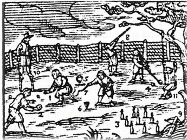
Imagen 1: juegos de bolos infantiles. (Ruíz Alonso, 1983)

Según el historiador griego de la conquista romana Estrabón, las diversiones de los astures durante esta época eran lanzar troncos, luchar y cazar. Es prácticamente imposible dar en el origen de estos juegos tan antiguos, y más tratándose de modalidades regionales, ya que aparecen en la historia desde el mundo antiguo hasta la actualidad. (Blázquez Martínez, 1989)