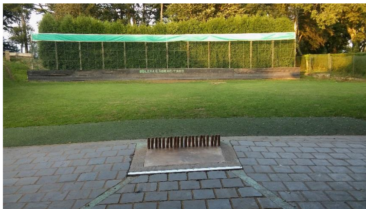
Imagen 11: bolos armados en la losa o "llábana".

Se arman los bolos en línea, perpendicular a la línea de tiro y paralelos a la "poya", separados entre sí aproximadamente 1 centímetro a lo largo. (Ruiz Alonso, 2000)