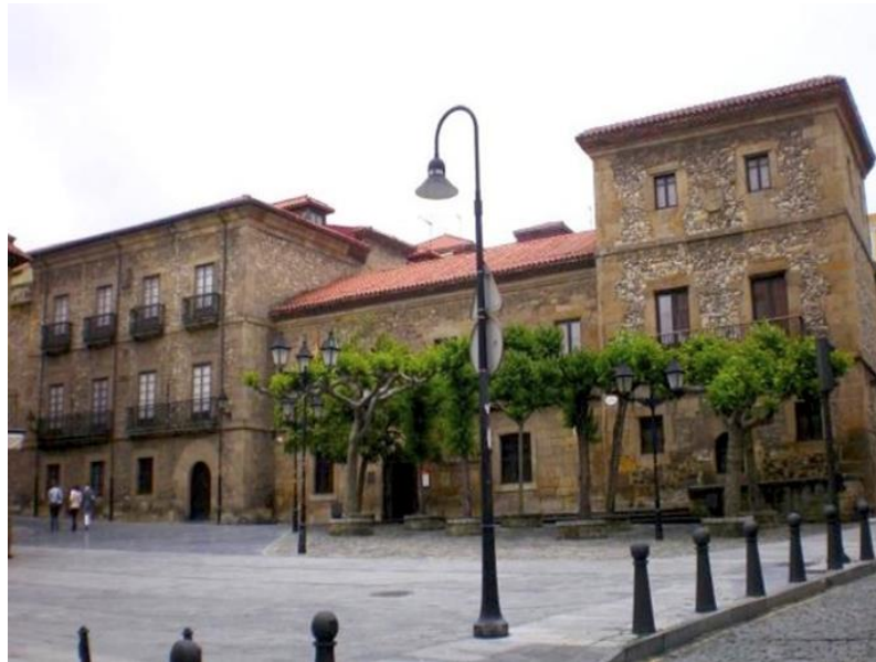
Imagen 3: Casa natal de Jovellanos, en Gijón. Dicen que donde están los árboles ahora es donde Jovellanos mandó poner los bolos antaño. (Ruiz Alonso, 1983)

Por último, el siglo XIX fue la época de esplendor de estos juegos. Durante el siglo XX, había un gran ambiente bolístico por todas las zonas de la región.