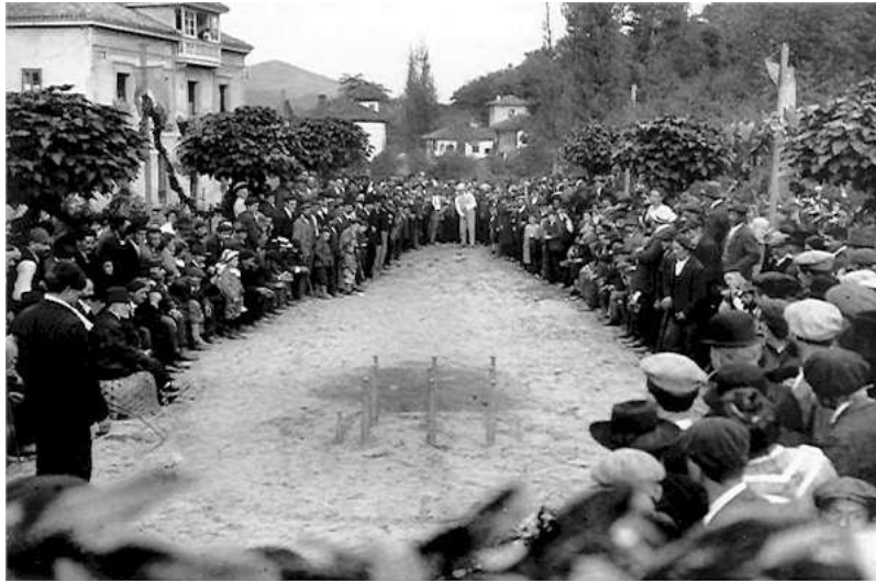
Imagen 5: Celebración de una partida de bolos en la Bolera de Villamayor en 1915. Imagen de Modesto Montoto. (Mencía Martínez, 2007)

A la bolera se iba, además de jugar a los bolos, a pasar el tiempo libre y a dedicar el tiempo de ocio. Los bolos son una actividad extraordinariamente popular, sostenida por una amplia estructura social que les permitió enraizarse en la comunidad como ningún otro tipo de juego lo había hecho antes. (Mencía Martínez, 2007)