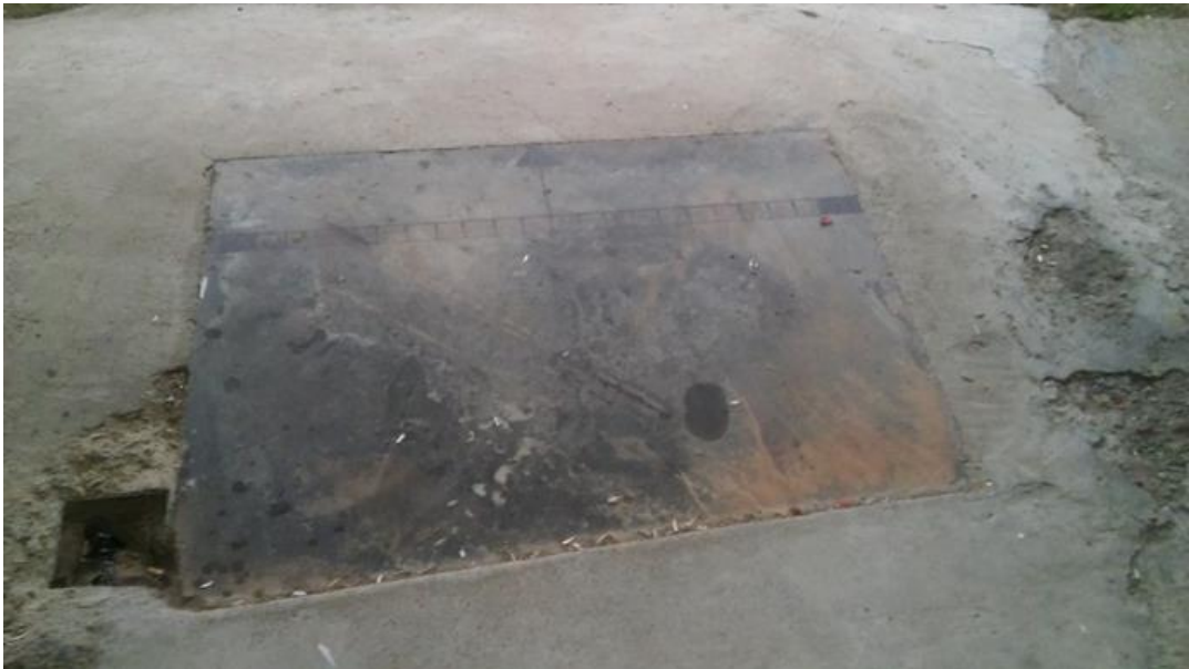
Imagen 16: "Llábana" o losa.