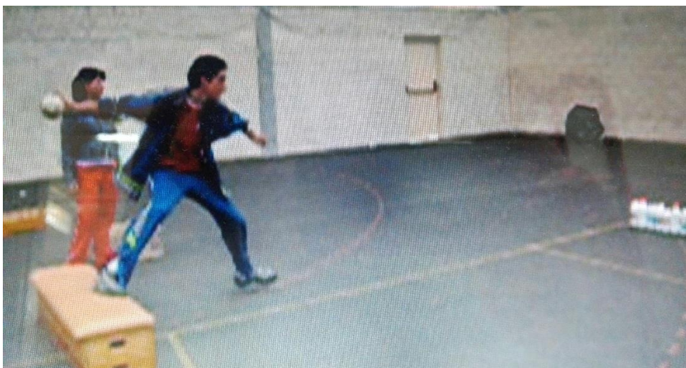
Imagen 14: adaptación al bolo de Tineo en una clase de Educación Física.

Así se encuentra la situación actual del bolo celta en la enseñanza secundaria y bachillerato en los diferentes centros del concejo. Para la puesta en práctica del juego, la villa de Tineo dispone de una bolera infantil (Anexo IV). Además de esta bolera, los docentes también pueden realizar adaptaciones al juego de bolos en las respectivas clases, como se puede ver en esta imagen.