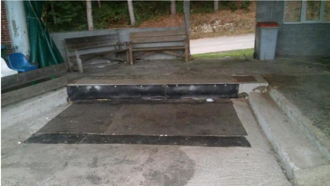
Imagen 15: "Poya".