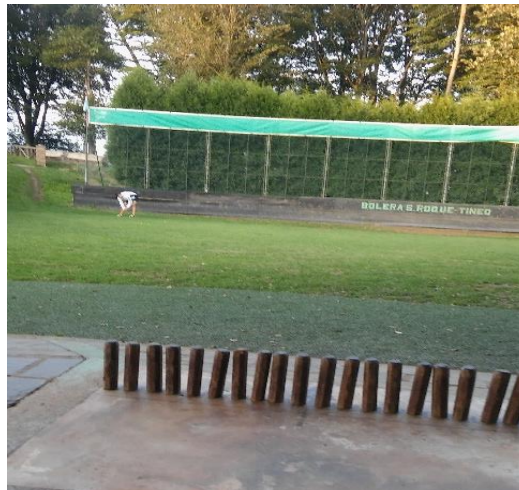
Imágenes 9 y 10: los dos tipos de lanzamientos, "bajar" y "sacar".

En la primera tirada, los bolos derribados en el terreno comprendido entre la losa y la raya de 10 valen 1 punto o 1 tanto; los bolos lanzados que pasen de la "raya de 10" valen 10 puntos, y, por último, los bolos que saltan por encima de la valla valen 50 puntos y conceden la victoria en el juego al participante; a esto se le denomina también "bola de juego".