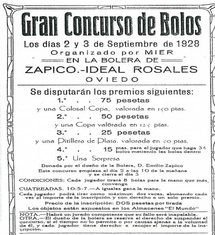
Imagen 7: Cartel de un concurso de bolos durante las fiestas de San Mateo (Oviedo). (Mencía Martínez, 2007)