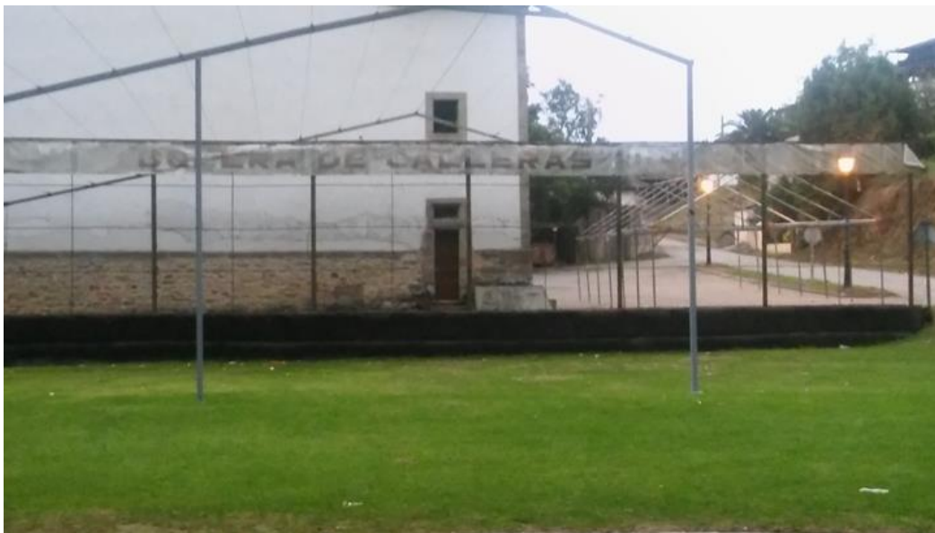
Imagen 18: "Acabón o Red de bolo a juego".

En este anexo aparecen las representaciones gráficas de las partes de la bolera; las cuales están detalladas en el apartado 5.1.5.