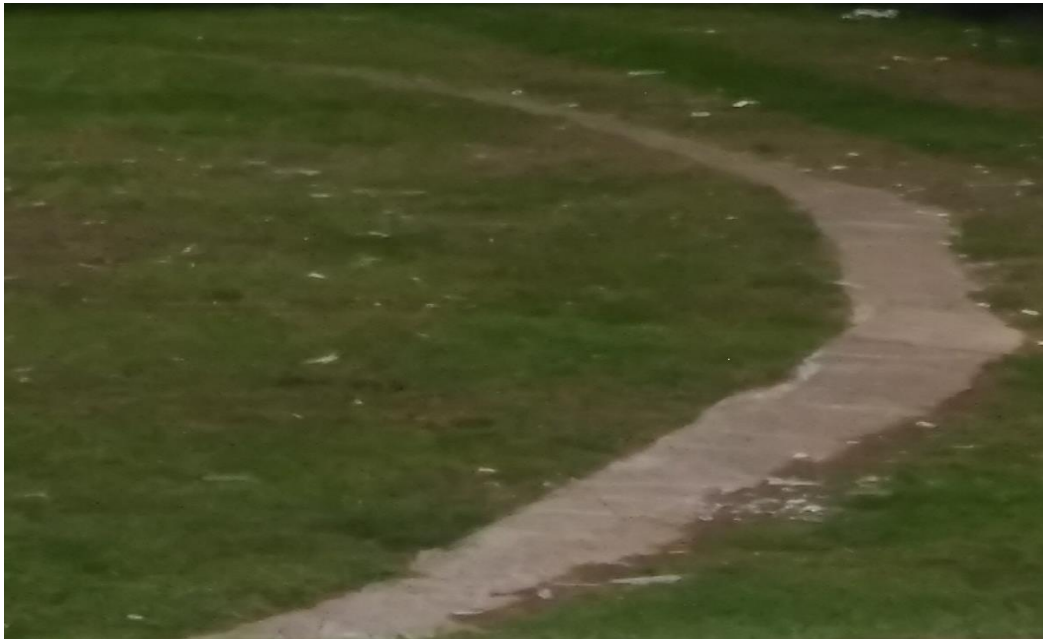
Imagen 17: "raya de 10"