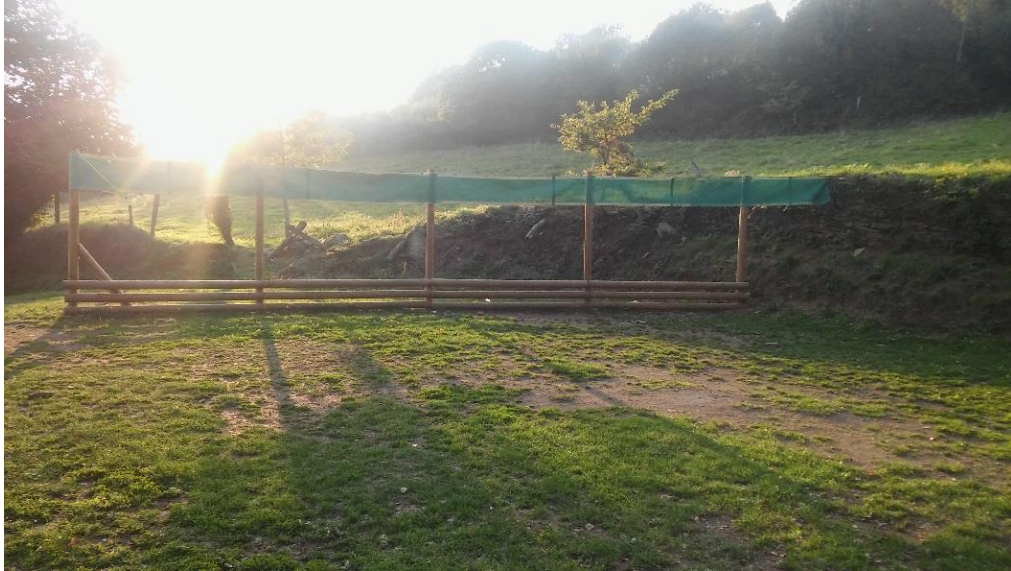
Imagen 19: "Acabón" o Red de bolo a juego.

Esta bolera se encuentra al lado de la bolera principal de la villa, la bolera de San Roque.