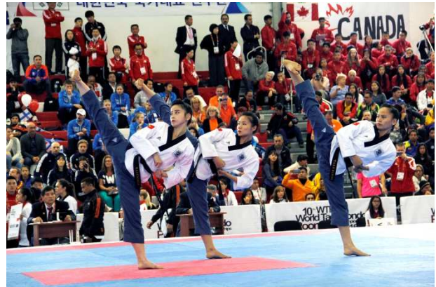
Figura 7. Competidores realizando un Poomsae por equipos.

Como conclusión al apartado de formas podemos decir que las diferencias entre federaciones son abismales. El objetivo de ambas sin embargo es el mismo, la práctica de las técnicas sin necesidad de un oponente. También cabe recordar que nos encontramos ante un arte marcial, y la práctica de las formas es uno de los puntos esenciales en éstas. Por lo tanto el mantenimiento de la práctica y las competiciones de Tul y Poomsae, en mi opinión, es una forma de mantener la esencia del Taekwondo.