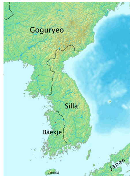
Figura 1. Península de Corea durante la época de los tres reinos.