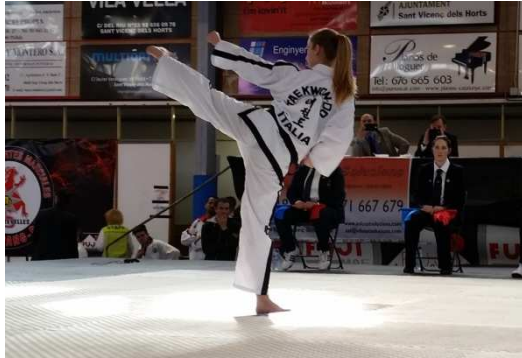
Figura 4. Representante de Italia compitiendo en la categoría de tul individual.