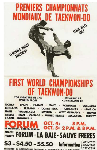
Figura 3. Cartel del primer campeonato del Mundo. Por ITF, 2017, http://www.taekwondoitf.org/es/our-history/our-history/

En cuanto a competición, actualmente existen modalidades de Tul individual (véase Figura 4) y Tul por equipos de cinco personas (véase Figura 5). Se compete tanto a nivel nacional, como continental y mundial. En España tenemos bastante nivel en este apartado, hemos ganado varias medallas en campeonatos europeos y mundiales tanto en Tul individual o por equipos, un ejemplo es Miguel Serrano, campeón del mundo en 2013 en Tul individual.