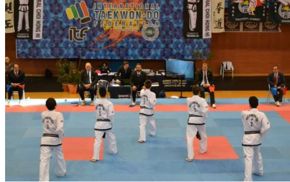
Figura 5. Representantes españoles compitiendo en la categoría del tul por equipos.

Por otro lado nos encontramos con los “Poomsaes”, el apartado de formas que se incluye en la “World Taekwondo Federation”.