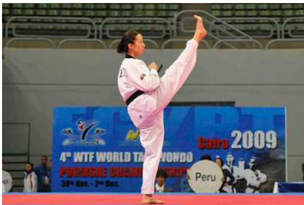
Figura 6. Practicante de Taekwondo ejecutando un Poomsae. 2009

Del mismo modo que los Tuls, los Poomsaes, además de la aplicación práctica como entrenamiento, también poseían un significado. Los Taegeuks querían transmitir una filosofía relatada en el libro chino “I Ching”, se pretendía utilizar para guiar al practicante en un sentido mental y espiritual al realizar las formas (Yu, et al., 2014). Como antes hemos mencionado, también los Poomsaes de cinturón negro hacen referencia a palabras con determinados significados.