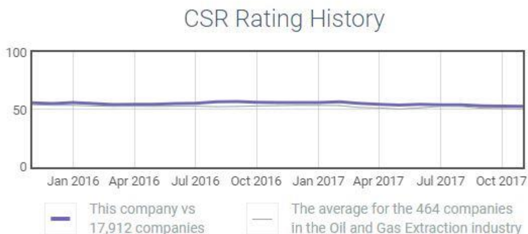
Gráfico 2: Historial de puntuaciones totales de RSC de las compañías petroleras y en general según CSRHub

Como podemos ver, las tres petroleras estadounidenses que se analizan en detalle en este trabajo son las de más baja puntuación de las seis; Chevron está levemente por encima de 50, por lo que podemos considerar que es una puntuación baja. Aun así, se encuentra ligeramente por encima de la media de las 464 compañías petroleras analizadas. Lo podemos ver en el gráfico 2.