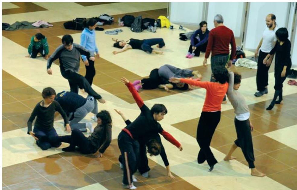
IMAGEN 1.—Jam en el Hall de la Facultad de Filosofía ULE.

El desarrollo de la investigación se ha llevado a cabo mediante inmersión en la práctica objeto de estudio con énfasis en los procedimientos de observación participante, a través de cuadernos de campo, siendo el límite temporal 2015. Como parte del método etnográfico, para este estudio se ha procedido a una recogida de datos a través de un cuestionario junto a varias formas de comunicación personal —entrevista en directo, telefónica y a través del correo electrónico—; se ha utilizado, además, una lista de uso interno elaborada en el primer Encuentro de Maestros y Organizadores de CI en España (EMOCIE) que se actualiza cada dos años desde 2010 2 . Finalmente, se ha completado la información con la consulta de los grupos y páginas web vigentes de CI en España (Tabla 2). Para el registro de los lugares de práctica han colaborado 42 personas informantes, todas ellas advertidas del objetivo del estudio y de su posible publicación.