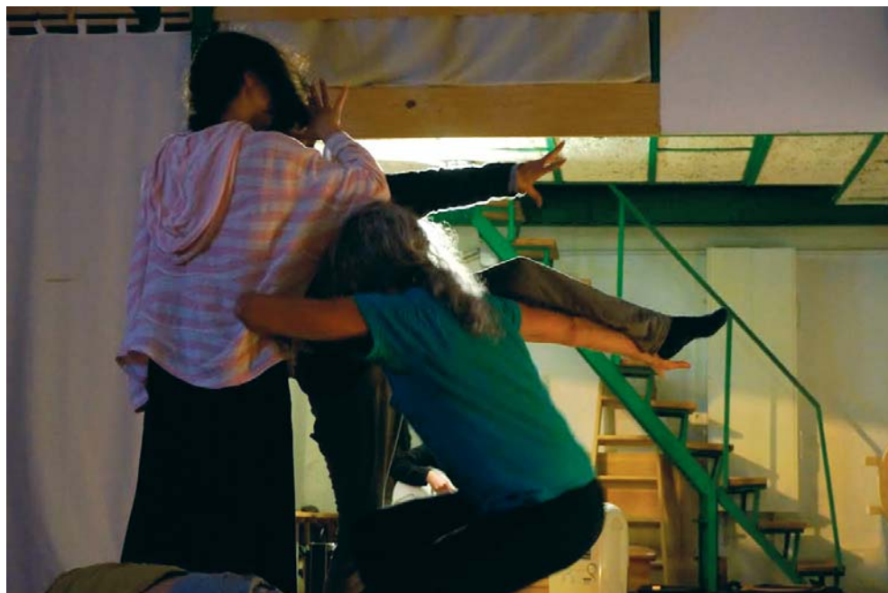
IMAGEN 5.— Jam en el Circo bajo el Tejado (Gijón).

(Tabla 3) y, ciertamente, las técnicas de circo comparten con el CI una didáctica cooperativa y creativa (Brozas y Vicente 1999) que genera la actividad en grupo.