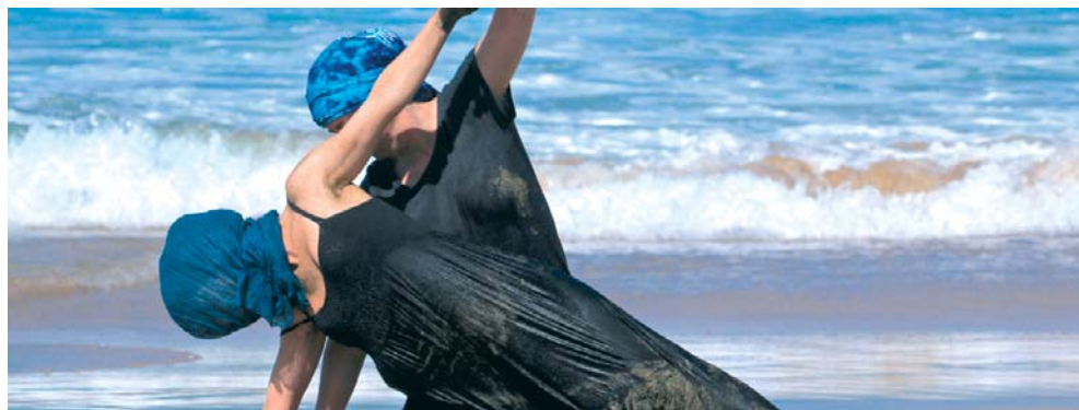
IMAGEN 2.—Fuerteventura CI < http://canarian.contactfestival.info/fuefestival/festival.html >

Es un encuentro artístico y social que durante 28 días congrega a más de 500 participantes nacionales e internacionales, en nuestra amada isla de Ibiza. Artistas profesionales, bailarines, amantes del movimiento y la improvisación, gente con ganas de aprender, o simplemente buscadores de nuevas experiencias, vida saludable y naturaleza, son las personas que cada año llenan de vida este festival (< http://ibizacontactfestival.com/es/inicio/ >).