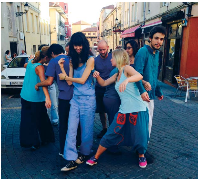
IMAGEN 4.—Big Crunch Project en las calles de León 2015.

Un caso de mayor incidencia, por afectar a distintas ciudades a la vez —Málaga, Badajoz, León y Almería—, fue la acción coreográfica denominada The Big Crunch Project , una manifestación colectiva de arte social en la calle que tuvo lugar en junio de 2015 (< http://thebigcrunch.org/ >); un evento similar, de carácter internacional, fue el Global Underscore ; propuesto a partir de la iniciativa de bailarines americanos pero que también se realiza en España, al menos desde 2012; se trata de una estructura coreográfica de improvisación que se despliega para bailarse, simultáneamente, en distintos puntos del planeta (< http://globalunderscore.blogspot.com.es/p/blog-page_29.html >).