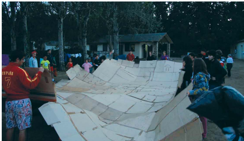
IMAGEN 3.— Jam en Campamento Scout (Vigo de Sanabria) 2011.