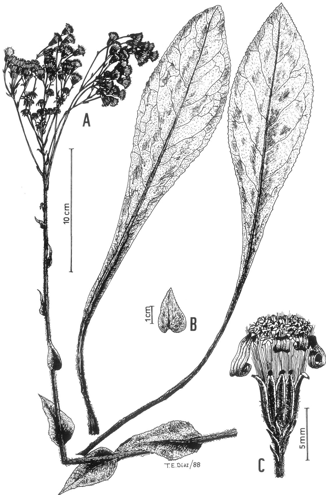
Figura 4. Senecio laderoi subsp. cantabrica C.P. Morales, M.E. García & A. Penas. subsp. nova. A: aspecto general. B: detalle de una hoja caulinar media. C: detalle del capítulo. Localidad: Valcovero (Palencia), 30TUN54. LEB 26987.