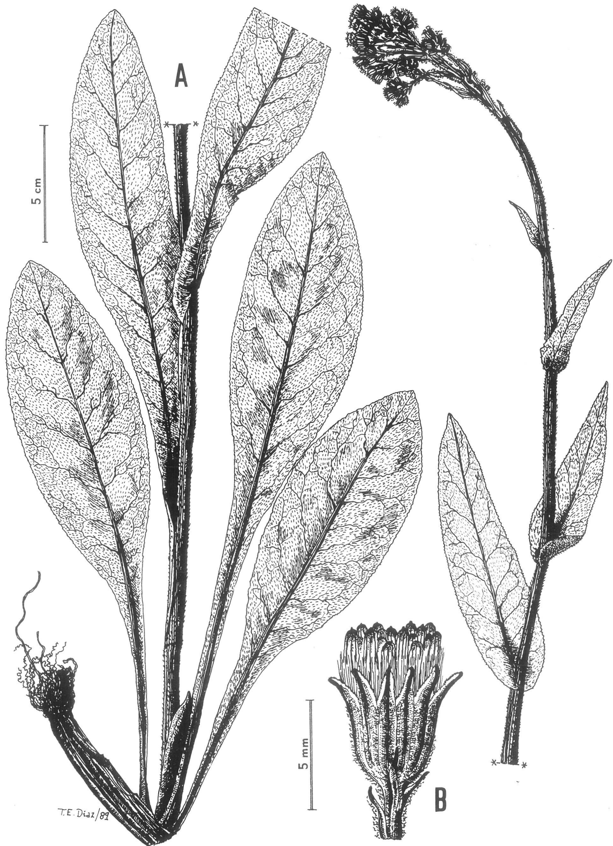
Figura 3. Senecio laderoi C.P. Morales, M.E. García & A. Penas sp. nova. A: aspecto general. B: detalle del capítulo. Localidad: Alto de Casares (León), 30TTN75. LEB 40600.