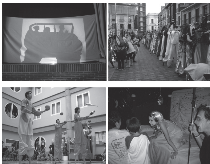
Foto 1. Algunos de los montajes finales con resultado de espectáculo, aunque no en todas las unidades es así, pero son la antesala (teatro de sombras corporales, pasacalles en zancos en carnaval, casa del terror y circo con combas en la calle).

Por todo ello, parece lógico que se deba producir un paso coherente en el quehacer diario de las ACI y la organización secuencial hacia las actitudes, y finalizar las unidades didácticas con unos trabajos que muestren tanto el proceso y la mejora individual como grupal (foto 1). A estos trabajos grupales se les ha denominado: Montajes Finales (Pérez-Pueyo, 2010b). Estos pretenden ser la manera de implicar a todo el alumnado en un proyecto que demuestre la posibilidad de cooperar con un objetivo común, aprendiendo a valorarse todos y cada uno de los alumnos respecto a sus posibilidades reales, aprendiendo a ponerse de acuerdo para conseguirlo y sin que se produzcan discriminaciones por razones de raza, sexo, capacidad intelectual o nivel de habilidad motriz.