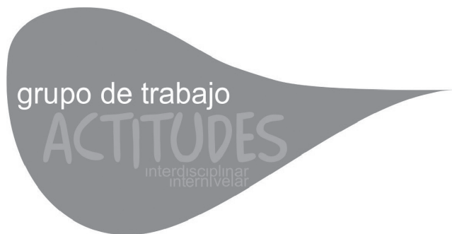
Imagen 1. Grupo de trabajo internivelar e interdisciplinar Actitudes ( www.grupoactitudes.es ).

e internivelar Actitudes (imagen 1), el cual ha permitido que la metodología evolucione gracias a los procesos de investigación-acción que ha generado.