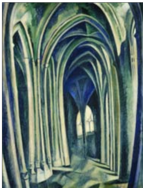
■ Ilustr. 4. R. Delaunay, Saint Séverin , 1911.