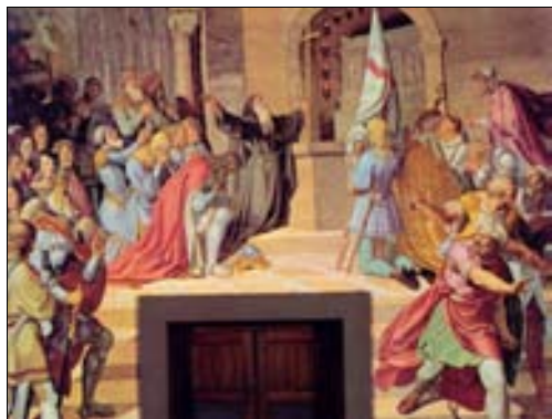
■ Ilustr. 1. J. Führich, Los cruzados ante el Santo Sepulcro , 1825.