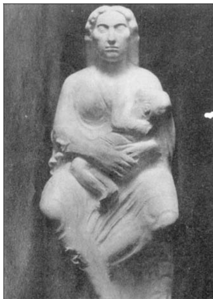
■ Ilustr. 6. F. Asorey, Mater , ca. 1916 (Tomada de R. OTERO TÚÑEZ, “O escultor Asorey. Vida e Obra”, Centenario Francisco Asorey , Santiago de Compostela, 1989).