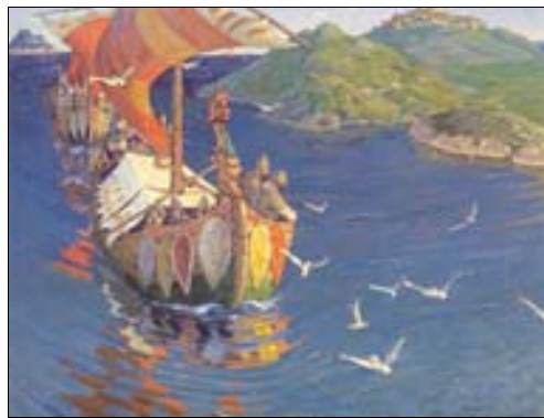
■ Ilustr. 2. N. Roerich, Los visitantes de tierras lejanas , 1901.