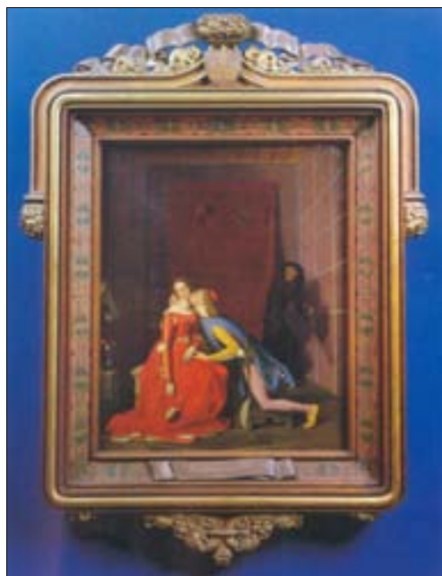
■ Ilustr. 8. J. D. Ingres, Paolo et Francesca , 1819.