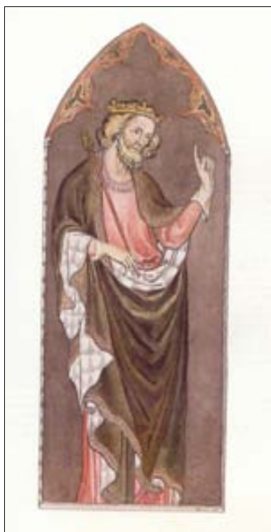
■ Ilustr. 7. W. Blake, Rey Sebert , ca.1775.