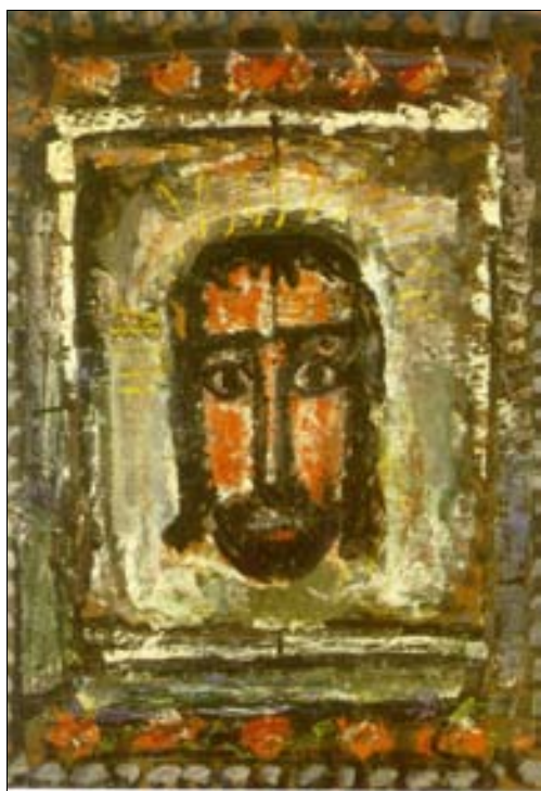
■ Ilustr. 5. G. Rouault, La santa faz , 1933.