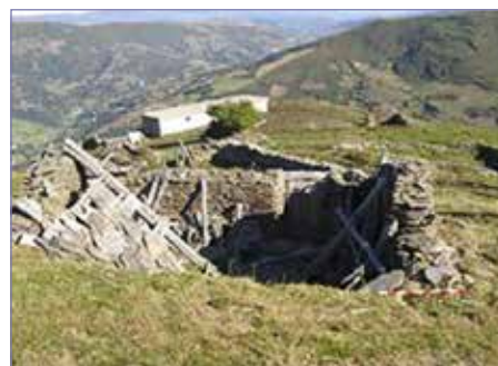
Fig. 3. Imagen de los restos constructivos en la braña de Saldepuesto

Pero lo que nos interesa señalar de esta braña es su uso compartido por dos parroquias de dos valles diferentes. La intercomunicación entre valles en los espacios ganaderos de montaña es una tónica bastante común, sobre todo si tenemos en cuenta la orografía de la región, donde los montes se convertirían en verdaderos puntos de reunión durante los meses estivales. Debemos de tener en cuenta la duplicidad de cánones sociales que ocurriría en las brañas durante el verano, trasladándose toda la actividad social de las aldeas a estas zonas, donde se realizarían fiestas, mercados, etc. (Fig. 3).