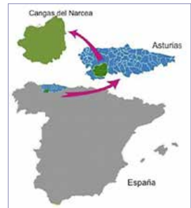
Fig. 1. Mapa de situación de Cangas del Narcea.

En nuestra zona de estudio abundan los suelos tipo Inceptisol / Umbretp e Inceptisol / Ochrept , con estratos rocosos donde apenas hay suelo y amplias pendientes se alternan con zonas más horizontales donde la deposición de sedimentos hace que la potencia de los suelos sea mayor, propiciando la creación de pastos y con una cada vez mayor presencia de monte bajo (PLAN FORESTAL DE LA COMARCA DE CANGAS DEL NARCEA 2010: 25).