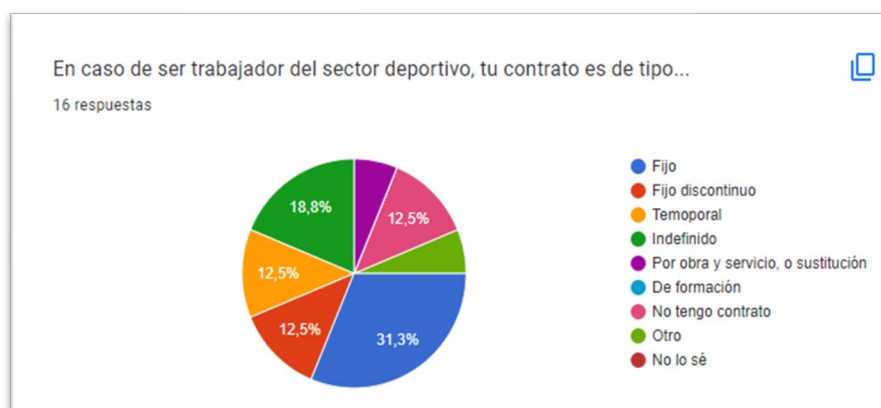
Figura 2. Tipos de contrato de los trabajadores del sector.

Otros resultados interesantes recogidos en dicho cuestionario son los siguientes: