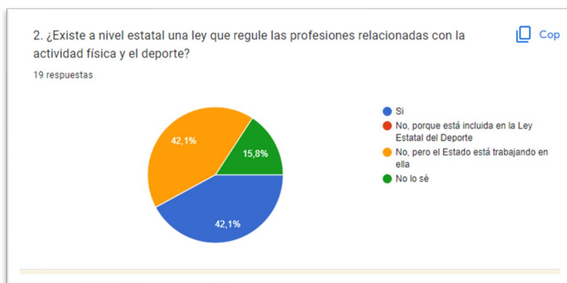
Figura 3. Conocimiento sobre regulación profesional en España.