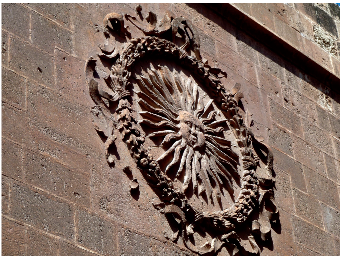
▪ Fig. 5. Sol de Portocarrero. Siglo XVI (segundo cuarto). Catedral (Almería).

y labrada en piedra extraída de las vecinas canteras de San Roque, representa la imagen de un sol antropomorfo e incandescente –de la que existe algún ejemplo en la alta joyería europea– circundada por una corona de hojas de laurel entremezcladas con granadas de abultada talla, sujetas por una volada cinta ondulante. Pese a que la obra no está documentada, se podría atribuir, con las reservas pertinentes, al propio Juan del Acebo, ya que como maestro mayor debía de estar formado en el arte de la escultura, dentro de una cronología aproximada a partir de 1545, pero, en ningún caso, en fecha posterior a 12 de mayo de 1555, a tenor de lo registrado en el contrato de “un censo por tres vida al monasterio de Santo Domingo (por) un solar en la colación de la catedral que está a las espaldas de la capilla del señor obispo donde tiene esculpido el sol” 37 .