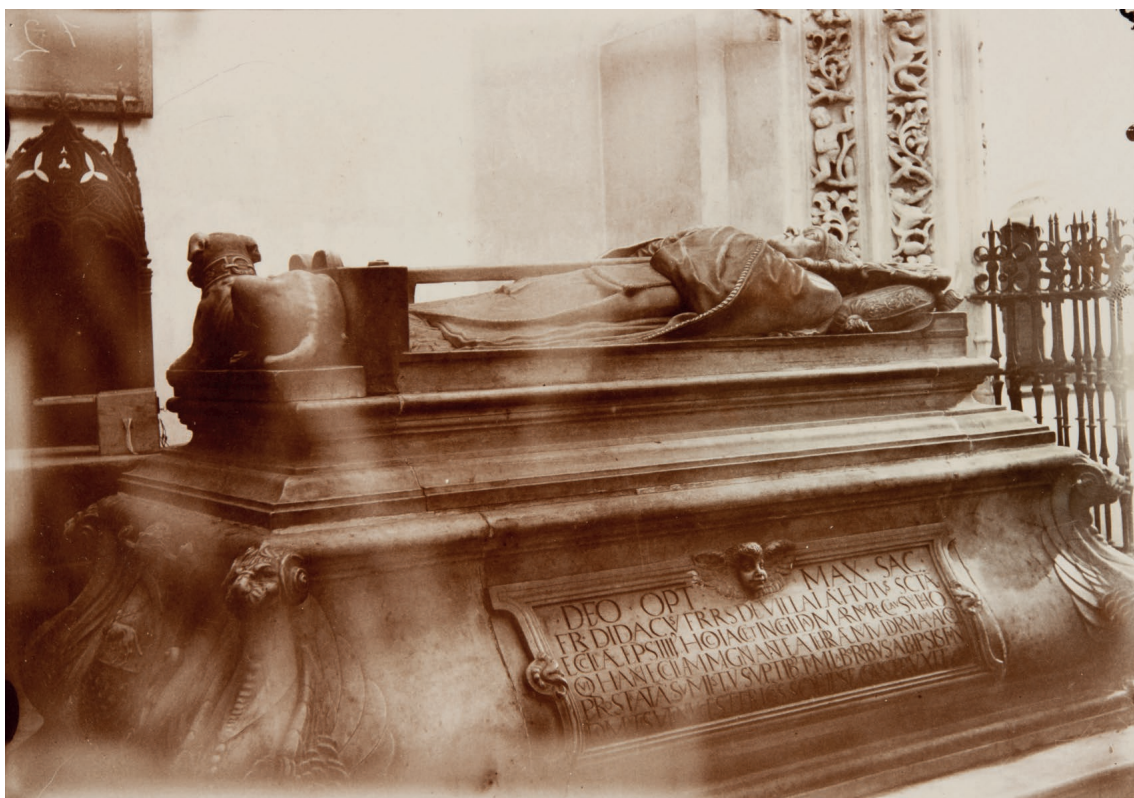
▪ Fig. 7. Juan de Orea. Sepulchro del obispo Fernández de Villalán. Fotografía en papel gelatina. Post 1907. Biblioteca Nacional (Madrid). Fotografía del Servicio de reproducción de la Biblioteca Nacional.

Las intrigas y corrupción de todo orden habidas en torno al anciano y achacoso fray Diego, impidió que el erasmista Luis de la Cadena llegará a ser consagrado obispo de Almería, a “causa de hombres perversos que le envidiaban por su prestigio”, pues la oposición de Fernández de Villalán a este nombramiento fue tal que no dudo en mentir ante el papa, valiéndose del prior de la catedral, Luis de Peñalosa, a quién dio su poder, el 22 de abril de 1555, para solicitar de Julio III la suspensión del nombramiento, ya que “por la misericordia de Dios estamos bueno y usamos y ejercemos el dicho nuestro oficio sin tener impedimento alguno que no lo impida”. Es comprensible que ante tantas injusticias, don Luis de la Cadena mandase escribir en su epitafio el deseo “de ser ente-