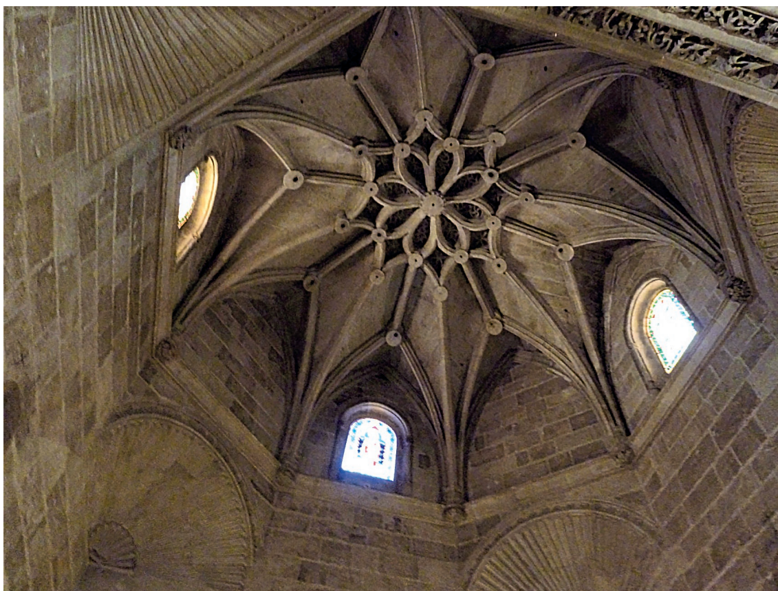
▪ Fig. 4. Bóveda de la capilla del obispo Fernández de Villalán. Siglo XVI (segundo cuarto). Catedral (Almería).

con cabeza de querubín (Fig. 4). Los nervios diagonales y las ligaduras terminan descargando en una primera serie de combados de disposición cóncava, que originan un sistema estrellado secundario, dentro del cual, a su vez, se inscribe otra serie de nervios combados que dibujan un esquema floral de ocho pétalos dispuesto en torno a la clave polar, ornamentada con bolas góticas, mientras que el resto de la plementería se recubre en este punto de una delicada tracería que se talla a tres planos a base de un dibujo geométrico que reproduce alternativamente cuadrifolias y esvásticas. Por lo demás, la capilla se ilumina a través de tres ventanas practicadas en los tramos del muro que corresponden a los ejes principales de la obra, y están orientadas hacia los puntos cardinales, norte, sur y este, quedando fuera de la composición el oeste, cuya luz queda ciega