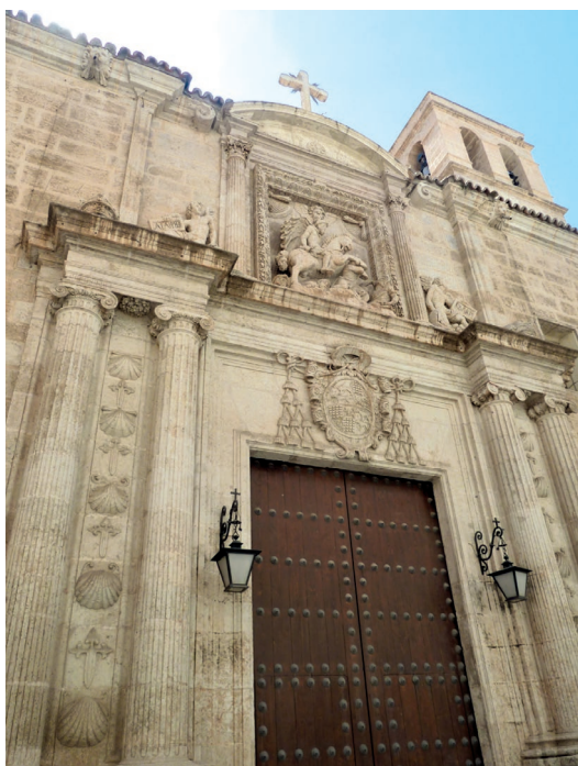
▪ Fig. 1. Juan de Orea. Portada lateral. c.1552. Iglesia de Santiago Apóstol (Almería).

el medallón homónimo del sepulcro de los Reyes Católicos (1514-1517) de Domenico Fancelli (1469-1519) de la Capilla Real de Granada, como también con el relieve de la batalla ecuestre del estilóbato izquierdo de la portada oeste del palacio de Carlos V en la Alhambra, tallado por Juan de Orea en 1550 sobre diseño de Pedro Machuca (c.1490-1550). La propaganda política e ideológica del grupo, con la representación del apóstol a caballo, revestido de soldado a la manera clásica, con el rostro barbado y fisonomía que recuerda a la del emperador Carlos, triunfante sobre los musulmanes sojuzgados violentamente a sus pies, se acrecienta con la presencia en la fachada del escudo del obispo promotor –compuesto según se corresponde con la heráldica eclesiástica de un arzobispo– junto a las figuras de dos efesos alados portadores de cartelas con los lemas ALANVS y QVARTVS , leyendas alusivas al patronímico del prelado y al número ocupado en el orden de la sede