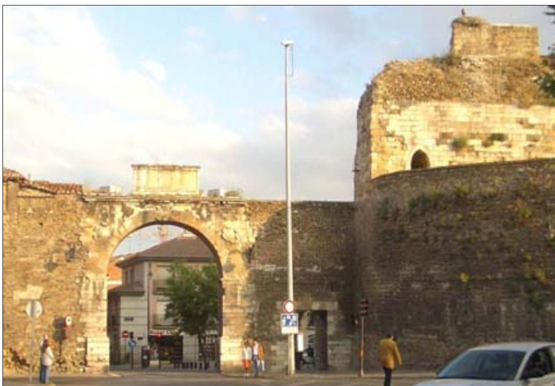
■ Lám. 4. Vista de Puerta Castillo, el pasadizo peatonal y la torre cuadrada del castillo