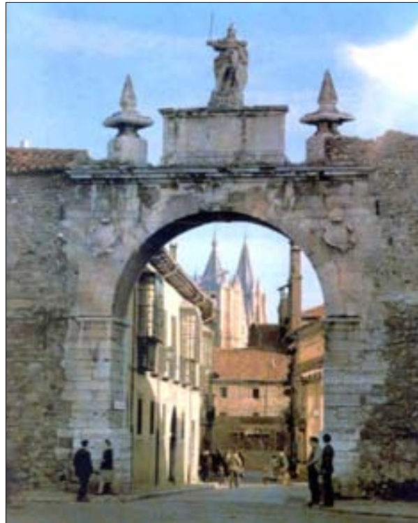
■ Lám. 1. Puerta Castillo antes de desmontar el remate