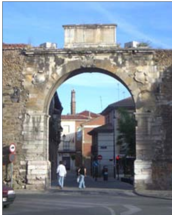
■ Lám. 2. Puerta Castillo en la actualidad