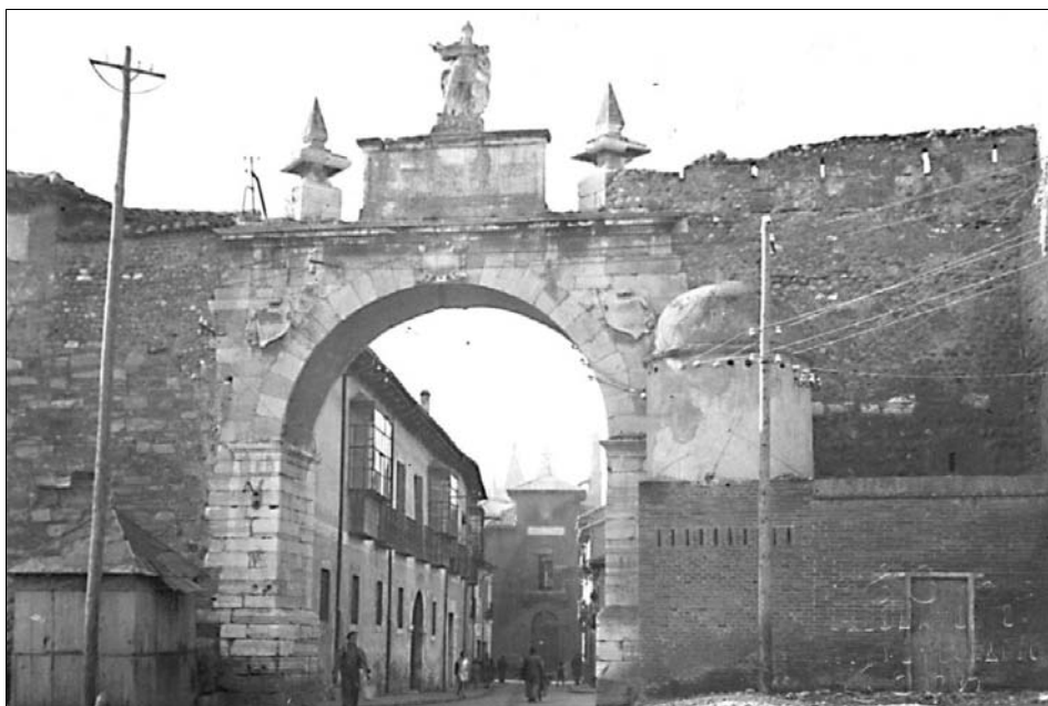
■ Lám 6. Foto antigua de Puerta Castillo con diversas construcciones adosadas