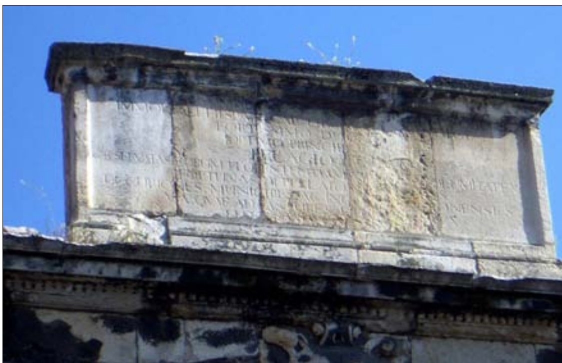
■ Lám. 11. La inscripción del pedestal de Pelayo

VERAE CLARISSIMAEQUE GOTHORUM REGUM SOBOLI INMORTALI HISPANICAE LIBERTATIS VINDICI FORTISSIMO DUCI OPTIMO PRINCIPE PELAGIO OBSERVATAS EORUM FLORENTISSIMAM URBEM INCOLUMITATEM FORTUNAS DEBELLATOSQUE MAUROS DECURIONES MUNICIPES AC INCOLAE LEGIONENSES VIA QUAE AD ASTURES DUCIT STRATA HAEC VOTA LITANT 1759