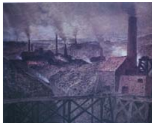
■ Lám. 2. C. MEUNIER, 1893.- El país negro (Museo d'Orsay, París)