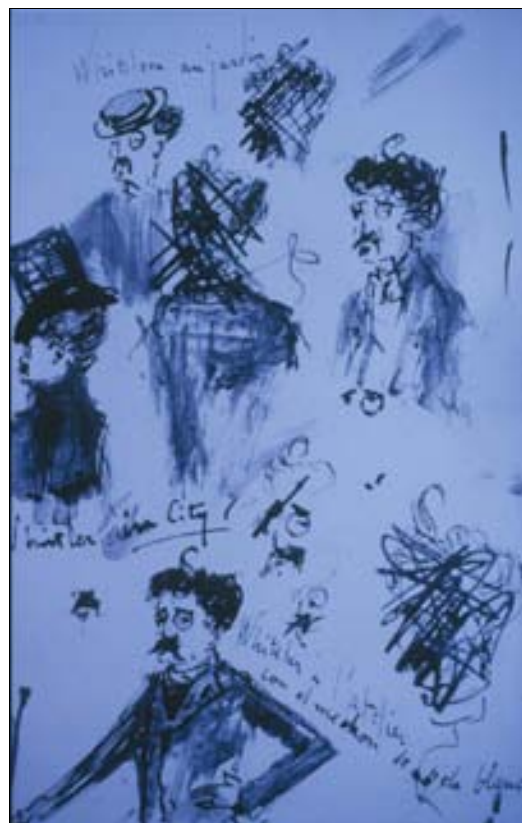
■ Lám. 17. D. DE REGOYOS, J.A. Mac. Whistler , 1885.