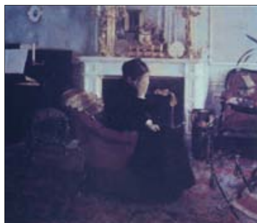
■ Lám. 10. F. KHNOPFF, Escuchando a Schumann , 1883 (Museos Reales de Bélgica, Bruselas).