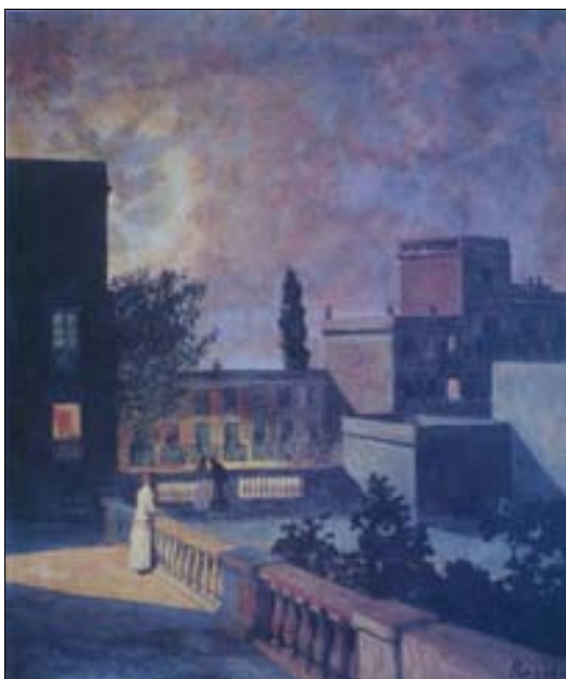
■ Lám. 14. D. DE REGOYOS, Nocturno , 1899 (colección privada)