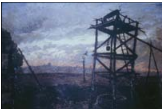
■ Lám. 1. D. DE REGOYOS, 1881. Alrededores de Bruselas (colección privada)