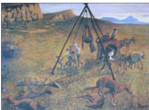
■ Lám. 11. D. DE REGOYOS, Víctimas de la fiesta , 1894 (Caja Astur).