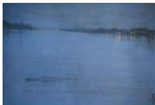
■ Lám. 16. J. A. MC. WHISTLER, Azul y plata , 1870 (Tate Gallery, Londres).