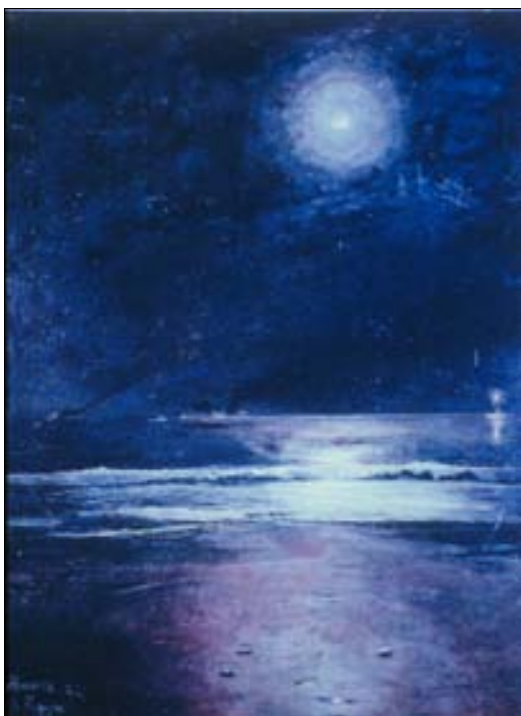
■ Lám. 15. D. DE REGOYOS, Playa de Almería , 1882 (colección privada).