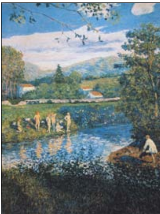
■ Lám. 18. D. DE REGOYOS, Baño en Rentería , 1899 (Museo de Bellas Artes de Bilbao).