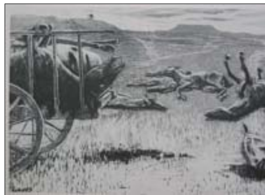
■ Lám. 12. D. DE REGOYOS, Víctimas de la fiesta , grabado (Casa Museo Abelló, Mollet del Mar).