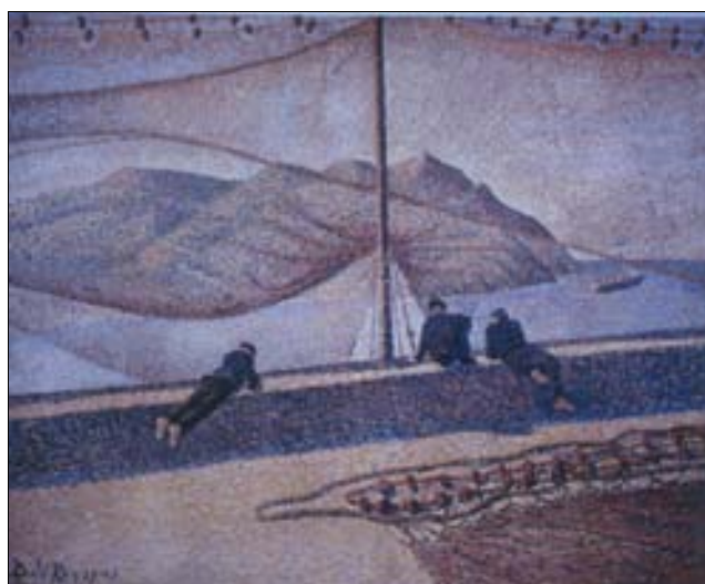
■ Lám. 13. D. DE REGOYOS, Las redes , 1893 (colección privada).