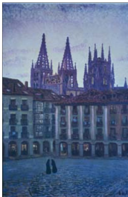
■ Lám. 6. D. DE REGOYOS, Hora pálida , 1906 (colección privada)