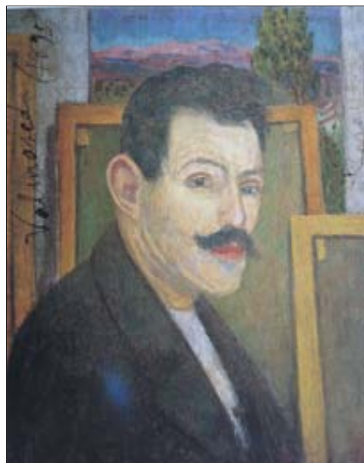
■ Lám. 19. D. DE REGOYOS, Autorretrato , 1895 (Museo de Bellas Artes de Asturias. Oviedo).