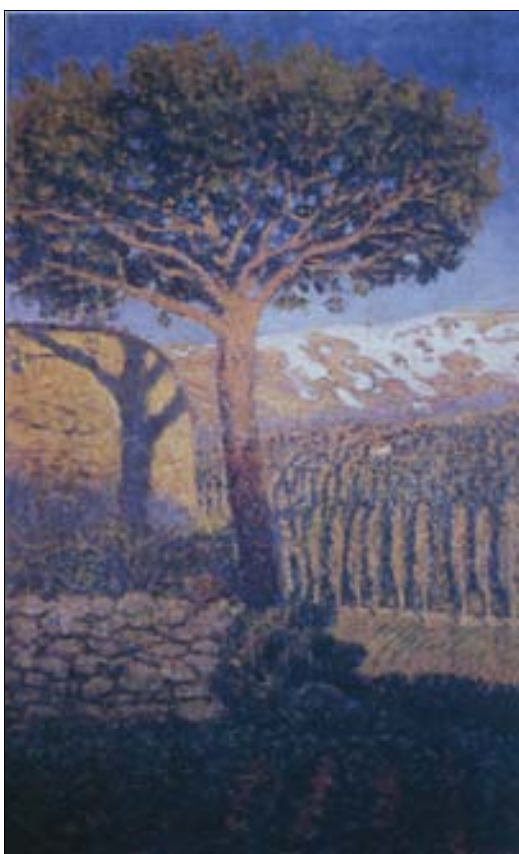
■ Lám. 7. D. DE REGOYOS, Pino y cumbres nevadas , 1900 (colección privada)