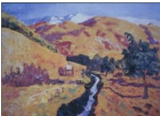
■ Lám. 5. D. DE REGOYOS, Camino de los neveros , 1911 (colección privada).