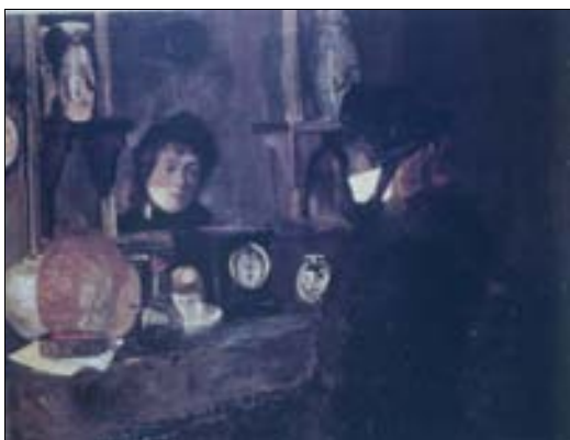
■ Lám. 9. F. D. DE REGOYOS, Dama ante el espejo , 1885 (colección privada). 1885 (colección privada)