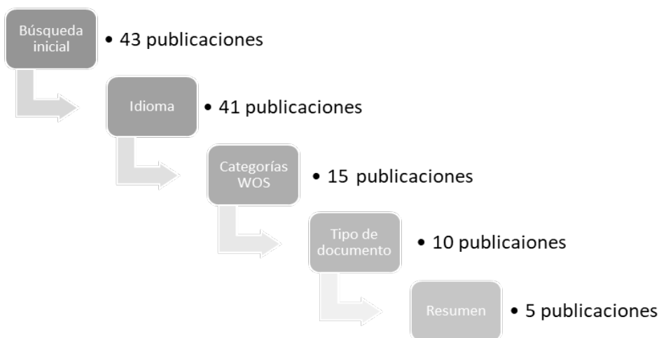
Figura 8.5 - Diagrama de selección de publicaciones de la Web of Science