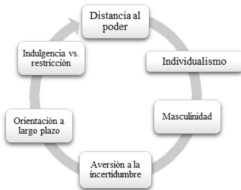
Figura 5.2 - Dimensiones culturales de Hofstede