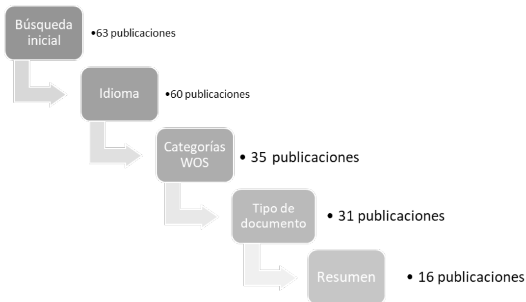
Figura 8.3 - Diagrama de selección de publicaciones de la Web of Science