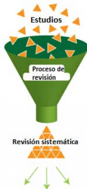
Figura 8.1 - Proceso de revisión sistemática