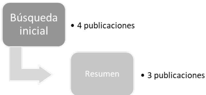
Figura 8.4 - Diagrama de selección de publicaciones de la Web of Science