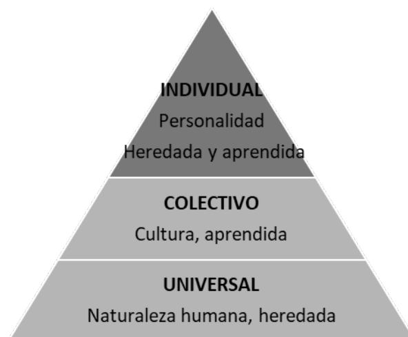
Figura 5.1 - Niveles de programación mental según Hofstede

El tercero y último nivel es individual, y es el único que es realmente exclusivo, puesto que no existen dos personas completamente iguales. Se encuentra en este nivel la personalidad de cada ser humano, y cuenta con un amplio rango de comportamientos dentro de personas que comparten la misma cultura. En el nivel individual al menos una parte de la programación debe ser heredada. De lo contrario, sería imposible explicar las diferencias de temperamento y actitudes entre dos niños criados por los mismos padres en entornos similares.