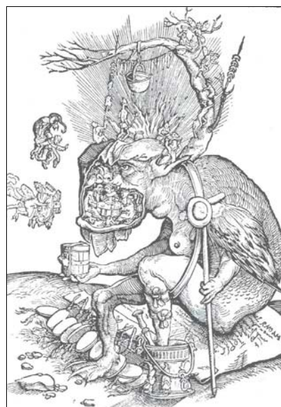
■ Lám. 4. Infierno, fines del s. XVI. Grabado alemán. (Imagen de E. y J. LEHNER, Picture books of devils, demons and witchcraft , New York, 1971, p. 166, Lám 232).