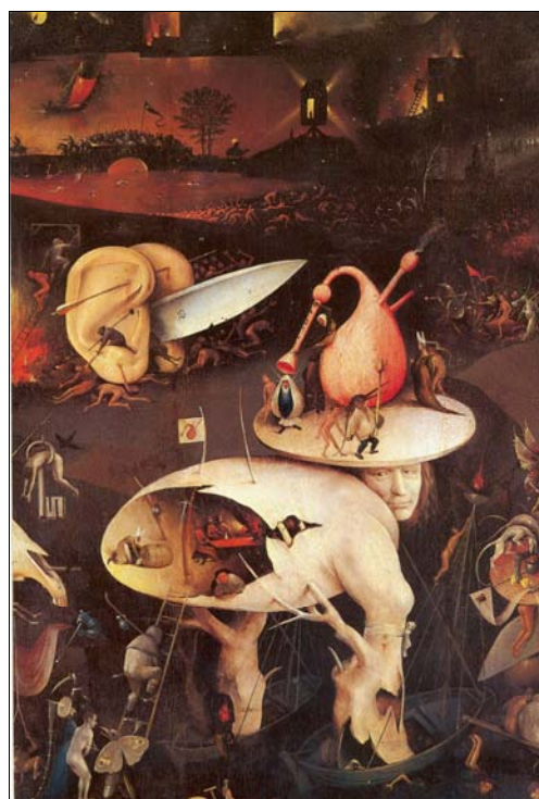
■ Lám. 3. El Bosco, El Jardín de las Delicias , c. 1500. Óleo sobre tabla, 220 x 195 cm. Madrid, Museo Nacional del Prado, cat. N o 2823.