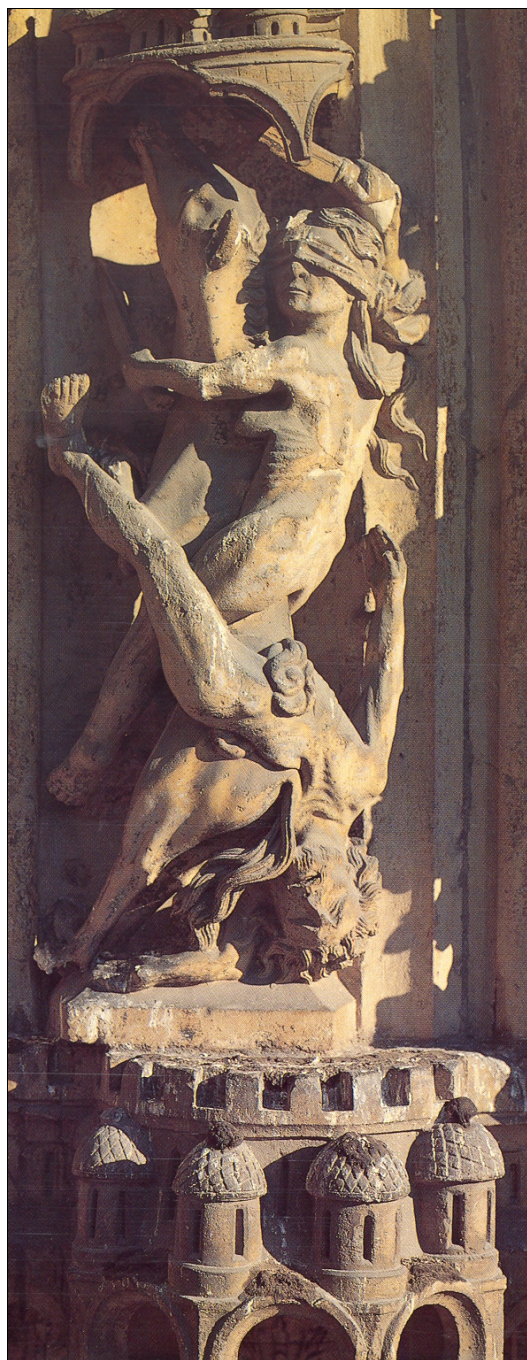
■ Lám. 1. París, catedral de Nôtre Dame, fachada occidental, ppios. s. XIII. Detalle: la Muerte. (Imagen de A. ERLANDE-BRANDENBURG, Nôtre Dame de Paris , París, cop. 1997, p. 145)